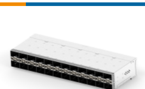
TE 产品编号2227838-9 2X12 ZSFP+ CONNECTOR ASSEMBLY