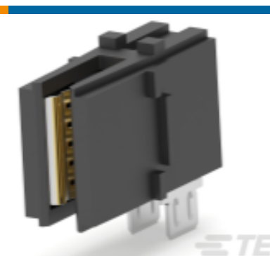
TE 产品编号2178531-4 Crown Clip Junior AG Plating Reflow