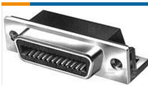
TE 产品编号6339447-7 RCPT ASSY,LP,SHLD,RA50,STD