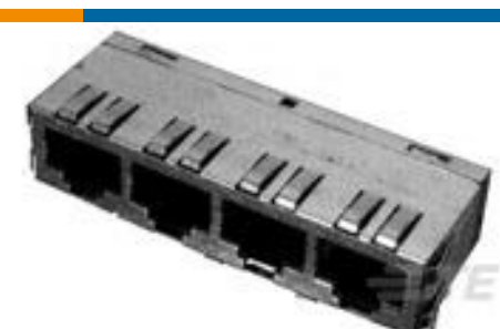
TE 产品编号1-5406203-2 MJ,ASSY,4P,8POS,CAT5,PNL TABS,.1S/T