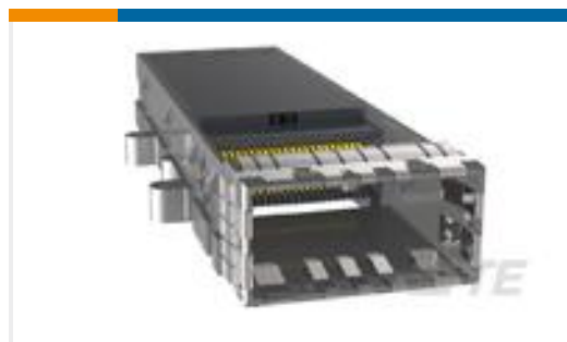
TE 产品编号2149733-1 Receptacle Assembly