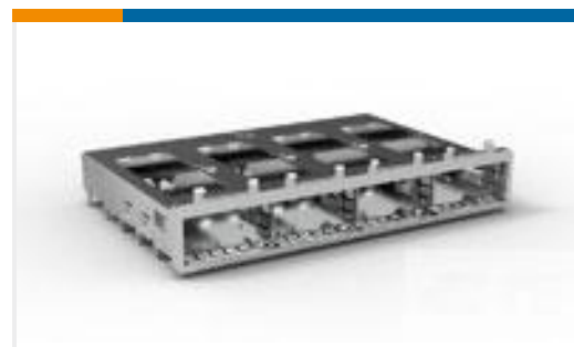
TE 产品编号2007668-1 1x4 QSFP Cage Assy Behind Bzl, LP Holder