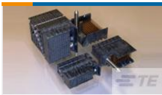
TE 产品编号2132568-1 IMP1000,HMP,V3P6C,UG,REW39,4.9