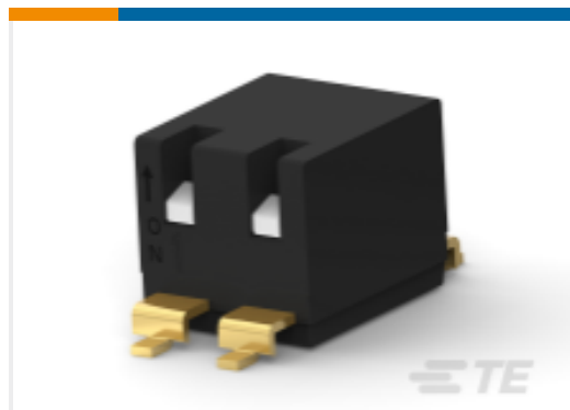
TE 产品编号1-2319764-6 E STACK PIANO 2P G SHORT TUBE PD OFF