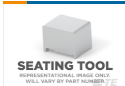
TE 产品编号 2018779-1 TL, SEAT, 2PR 10COL DAUGHTERC