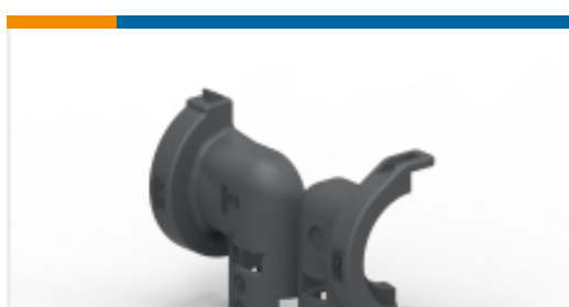
TE 产品编号1801468-1 COVER, ROTATIVE, 3 WAY HP CONNECTOR