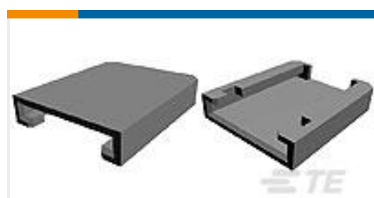
TE 产品编号144936-1 LOCKING DEVICE MQS