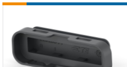
TE 产品编号2292534-1 PROTECTION CAP, TE, WATER DRAIN