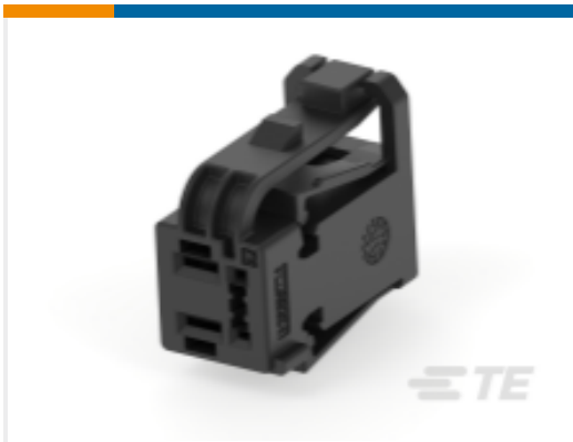
TE 产品编号1-2035077-1 PLUG HSG, 4 POSN HYBRID 0.64/2.8