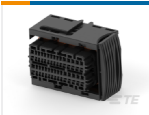
TE 产品编号2208277-3 60POS MQS REC SEALED