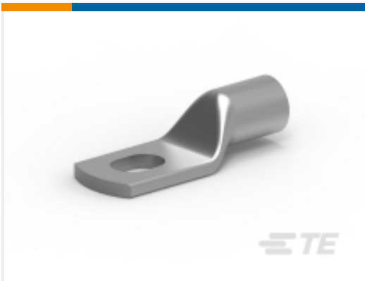
TE 产品编号3-2177380-1 RING TONGUE, CONTACT