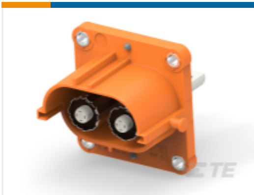
TE 产品编号2355198-2 HVP800 2P HEADER ASSY