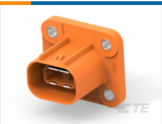
TE 产品编号2310540-1 HVA280 2P HEADER ASSY, KEY A