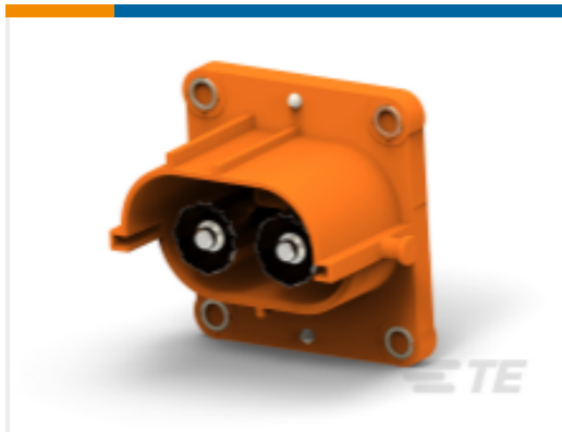
TE 产品编号3-2322122-1 HVP800 2P HEADER ASSY