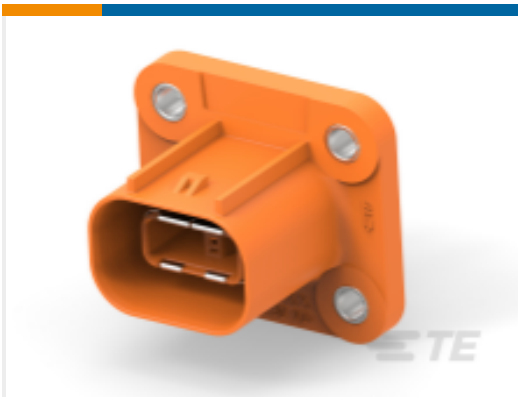
TE 产品编号2310540-2 HVA280 2P HEADER ASSY, KEY B