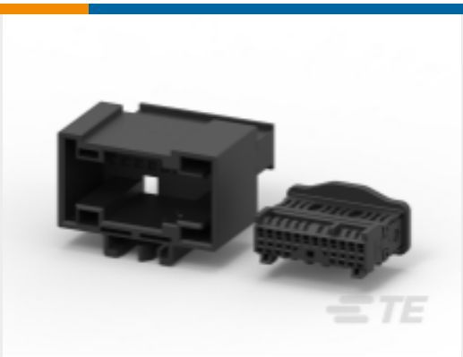
TE 产品编号2209477-1 MQS 连接器外壳