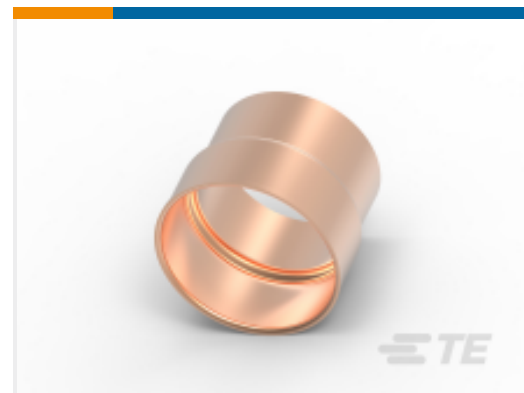
TE 产品编号9-2141157-1 SHIELD CRIMP FERRULE,90DEG