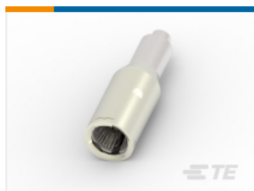
TE 产品编号2141212-1 8MM HV,SOCKET PIN TERMINAL