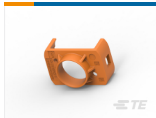
TE 产品编号2141155-1 PROTEC. COVER 8MM HV,90DEG