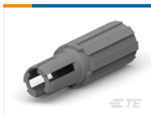
TE 产品编号2302636-1 INSULATION INSERT,180DEG,UL94V-0