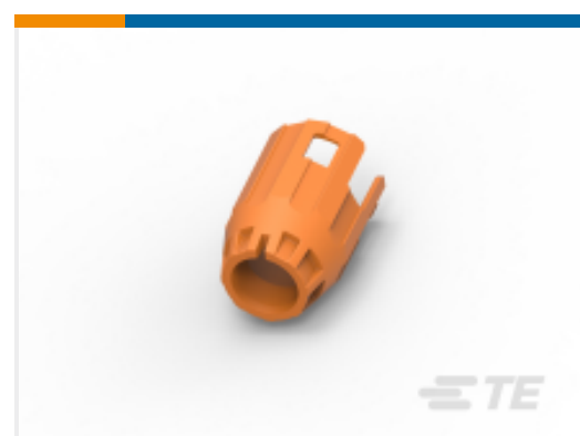
TE 产品编号2141159-1 FINGER PROT CAP 8MM HV,90DEG