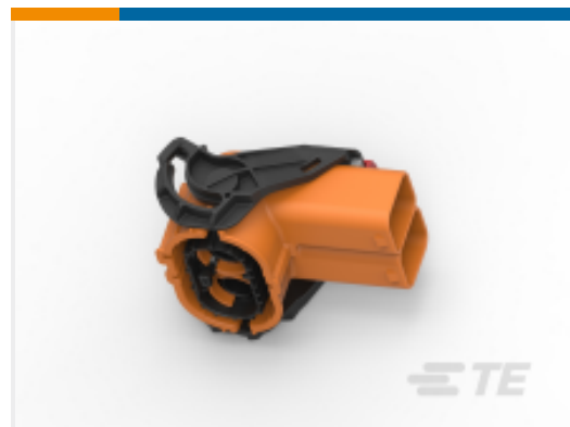
TE 产品编号1-2141154-1 2POS,8MM HV,REC HSG,90DEG,ASSY, SEALED