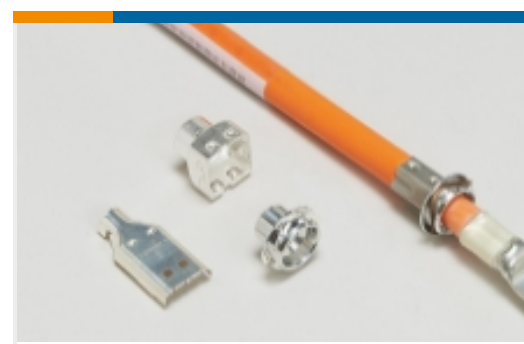
汽车连接器 EMC 屏蔽(7)