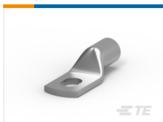
TE 产品编号2-2177380-1 RING TONGUE, CONTACT