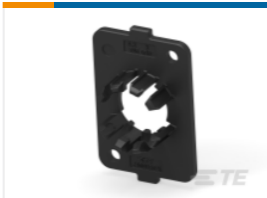
TE 产品编号2400920-4 CAB TIE,CLIP,25MM2