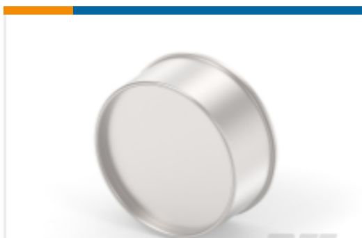
TE 产品编号1-2141261-1 SHIELD CRIMP FERRULE, INNER