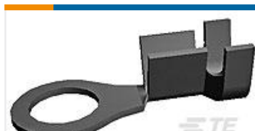
TE 产品编号42508-2 RING CRIMP 24-20 AWG TPBR