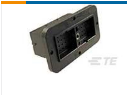
TE 产品编号DRC12-40PAE REC, 40P, BLK, E, FLANGE, A