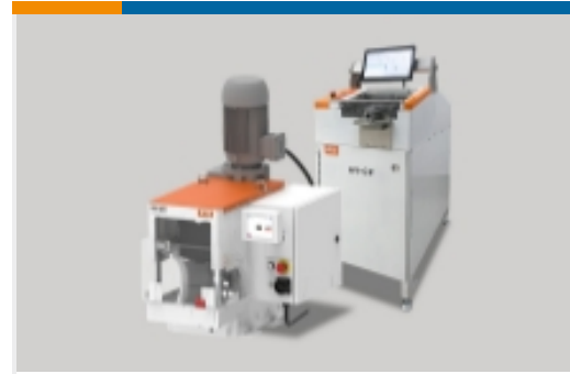
高压线束加工设备(13)