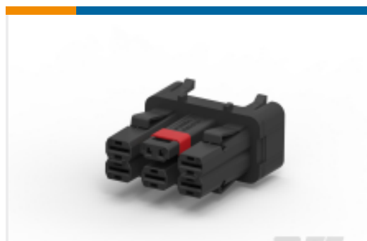
TE 产品编号2141630-1 5POS, HVA630, REC HSG ASSY, 180DEG, HVIL