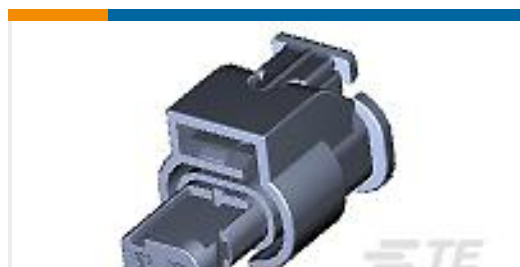
TE 产品编号3-1718643-1 2POS, MCON 1.2 LL REC SEALED