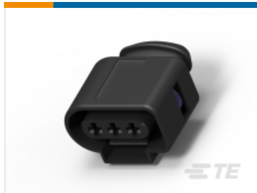
TE 产品编号2050994-1 JPT 3POS SEALED PLUG ASSY