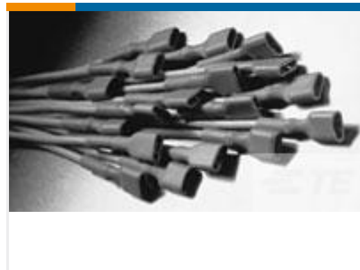
TE 产品编号4329854002 LSST-2.4-9-SP