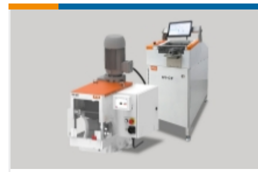
高压线束加工设备(13)