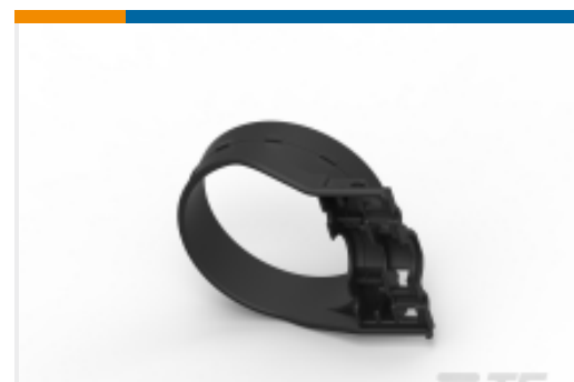
TE 产品编号2177790-1 CABLE FIXATION,TE,COVER INLET