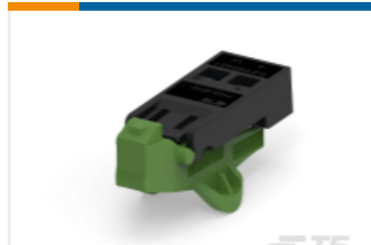
TE 产品编号2319940-4 TPA REC HSG,2POS,PCON21