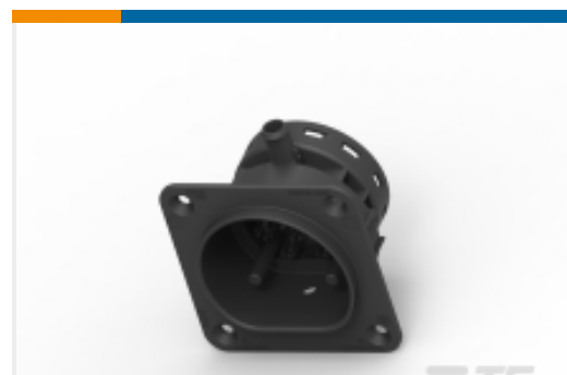
TE 产品编号2177786-3 5POS, MIXED,HSG, IEC62196-2 TYPE 2,Top