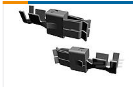
TE 产品编号927837-5 SPT REC 6.3 Contact SRC Ag