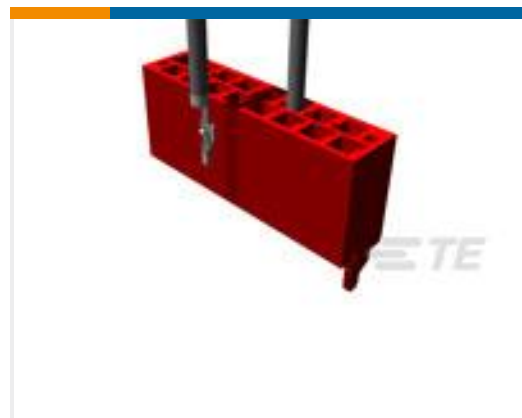
TE 产品编号338095-4 MICRO-MATCH COSIHSG