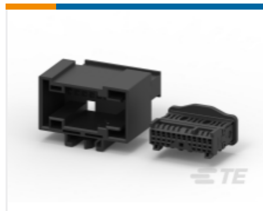
TE 产品编号2141466-1 MQS 连接器外壳