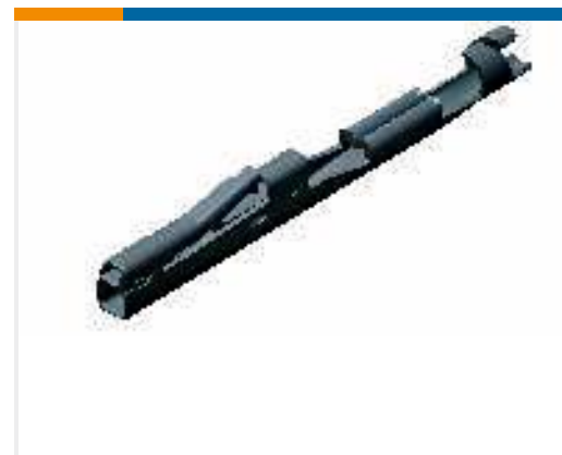
TE 产品编号2-1703930-1 NANOMQS, RECEPTACLE TERMINAL