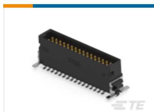
TE 产品编号254538-E SMCQ 32 M AB VV 8-03 CL * H007 137 E005