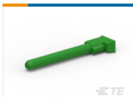
TE 产品编号2208113-2 BLIND PLUG 1.2 X 12.9, NANOMQS, GN