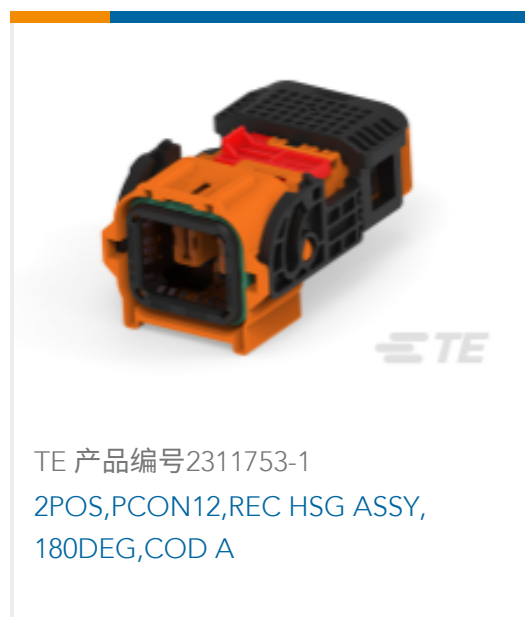
TE 产品编号2311753-1 2POS,PCON12,REC HSG ASSY, 180DEG,COD A