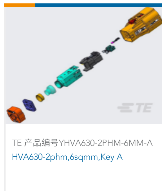
TE 产品编号YHVA630-2PHM-6MM-A HVA630-2phm,6sqmm,Key A