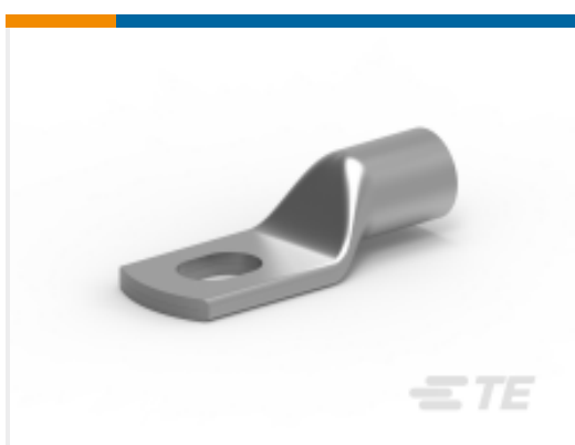
TE 产品编号3-2177380-1 RING TONGUE, CONTACT