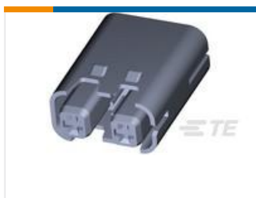
TE 产品编号1587985-1 INNER HSG SUBASSY, HVA280-2PHM