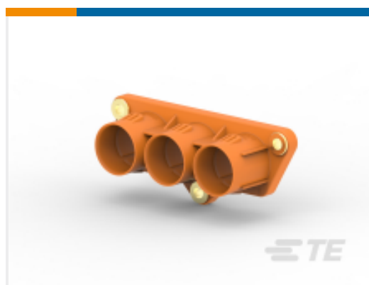
TE 产品编号2141783-2 3POS,RING TONGUE,HSG,ASSY, SEALED