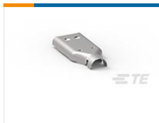
TE 产品编号2103157-1 SHIELD, PLUG, SIZE 1, Sn, HVA280