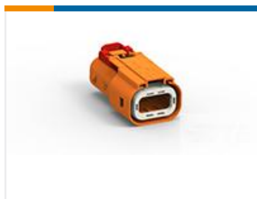
TE 产品编号4-2103015-1 PLUG SUBASSY, A, HVA280-2PHM F