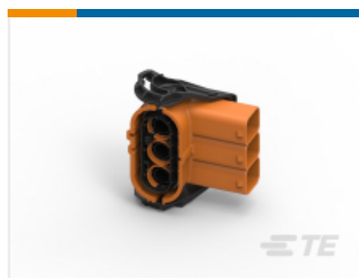
TE 产品编号1-2141166-1 3POS,8MM HV,REC HSG,90DEG,ASSY, SEALED