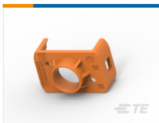
TE 产品编号2141155-3 PROTEC. COVER 8MM HV,90DEG