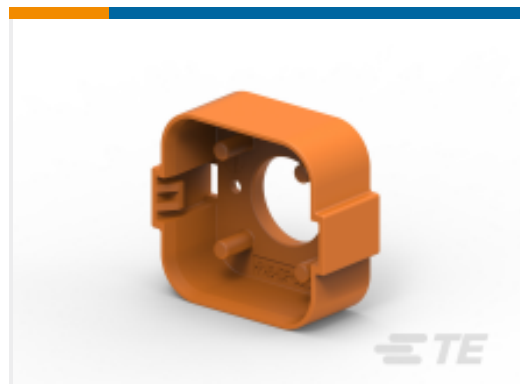
TE 产品编号2141265-4 COVER,SEAL