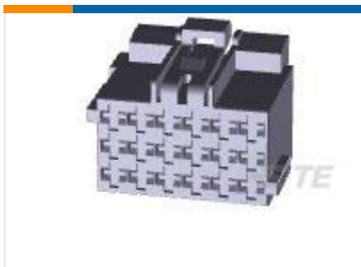
TE 产品编号1-965640-3 JUN-POW-TIM GEH 6P