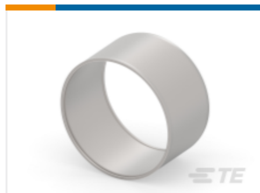
TE 产品编号2177061-2 SHIELD CRIMP FERRULE,180DEG