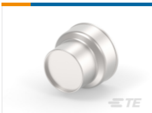
TE 产品编号1-2141263-4 SHIELD CRIMP FERRULE,OUTSIDE