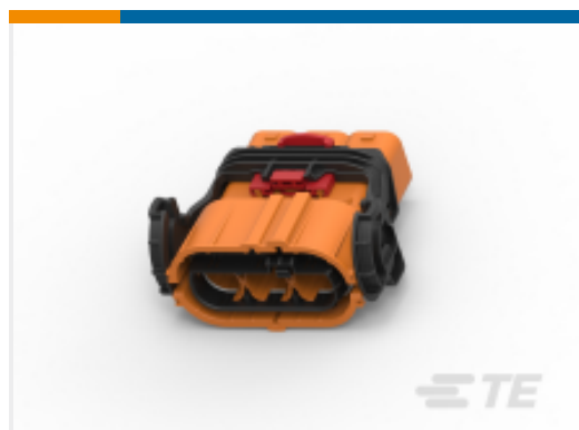
TE 产品编号1-2177063-2 3POS,8MM HV,PLUG HSG,ASSY, SEALED