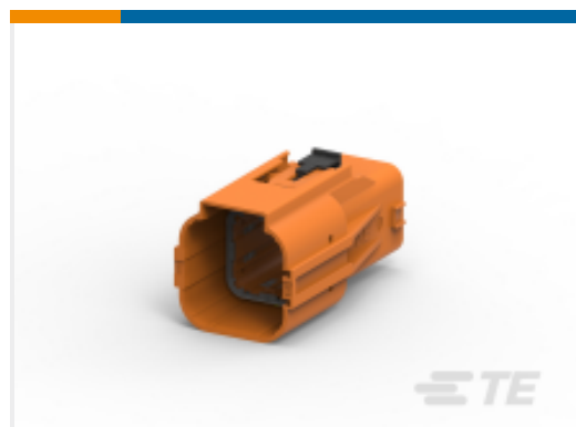
TE 产品编号2141256-1 2POS,AMP MCP6.3/4.8K,REC HSG, ASSY