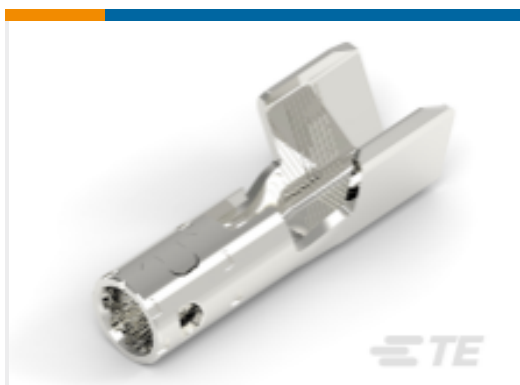
TE 产品编号2208608-3 8MM HV, CONTACT,ASSY