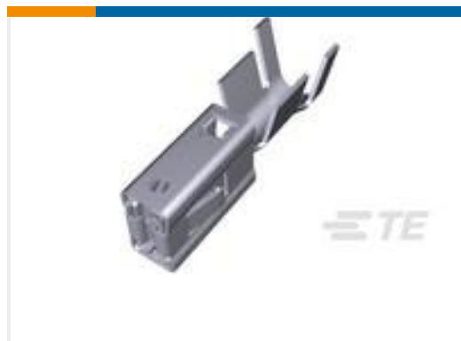
TE 产品编号2-1241408-3 AMP MCP 6.3/4.8K, CONTACT