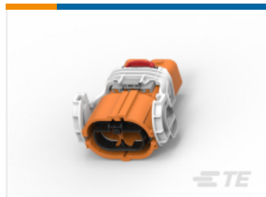
TE 产品编号1-2177053-3 2POS,8MM HV,PLUG HSG,ASSY, SEALED