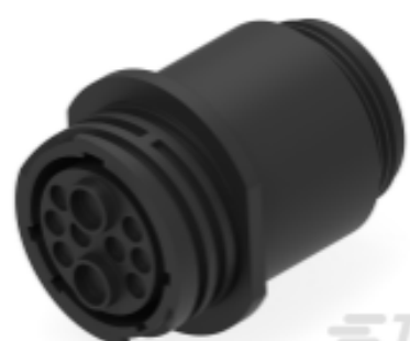
TE 产品编号 213894-2 CPC RECPT SEALED SIZE 17-10