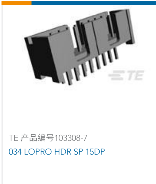
TE 产品编号103308-7 034 LOPRO HDR SP 15DP