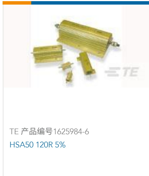
TE 产品编号1625984-6 HSA50 120R 5%