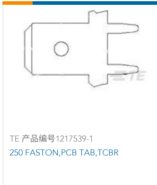
TE 产品编号1217539-1 250 FASTON,PCB TAB,TCBR