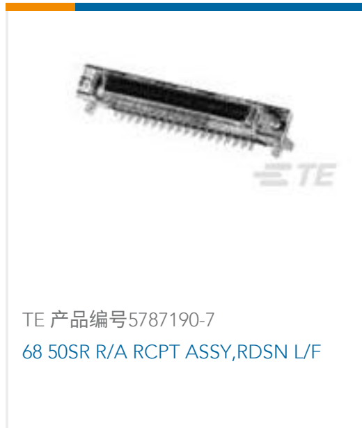
TE 产品编号5787190-7 68 50SR R/A RCPT ASSY,RDSN L/F