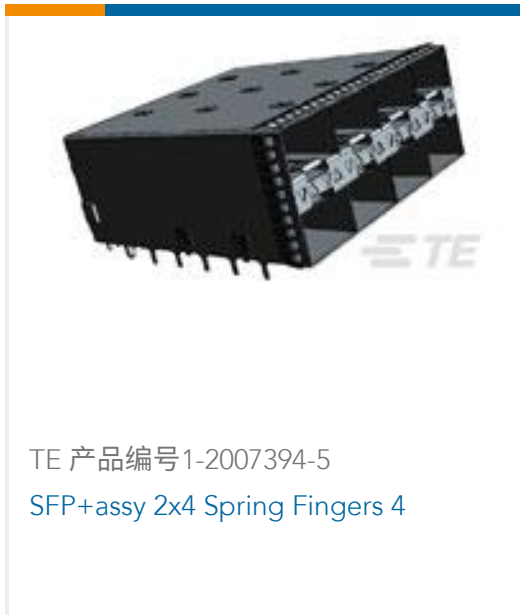
TE 产品编号1-2007394-5 SFP+assy 2x4 Spring Fingers 4