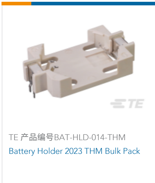
TE 产品编号BAT-HLD-014-THM Battery Holder 2023 THM Bulk Pack