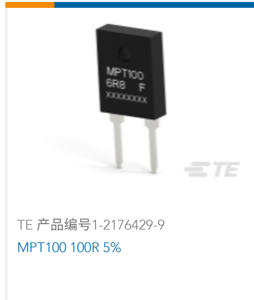
TE 产品编号1-2176429-9 MPT100 100R 5%