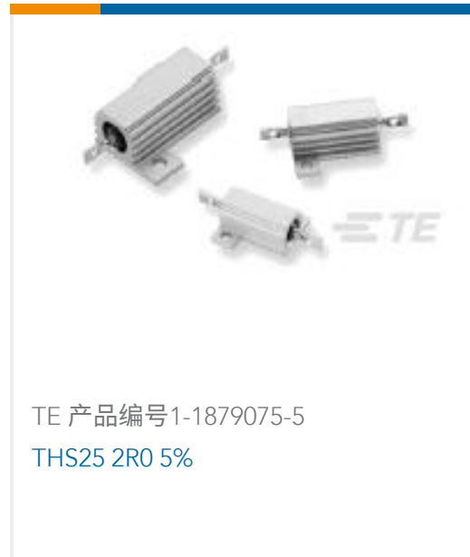
TE 产品编号1-1879075-5 THS25 2R0 5%