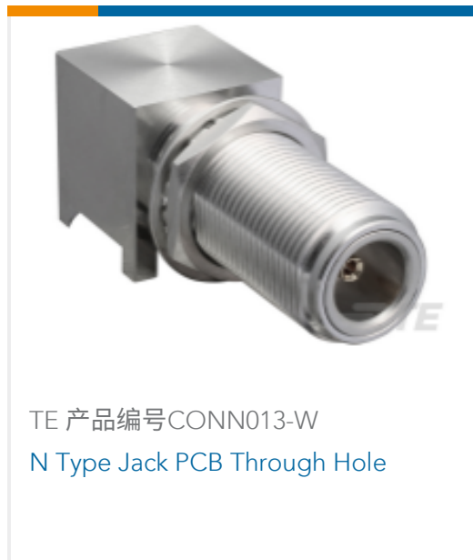
TE 产品编号CONN013-W N Type Jack PCB Through Hole