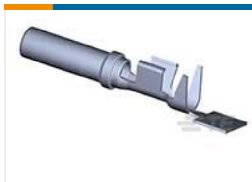
TE 产品编号1062-12-0144 SOC, SF, SIZE 12, 12-14, AU/SN