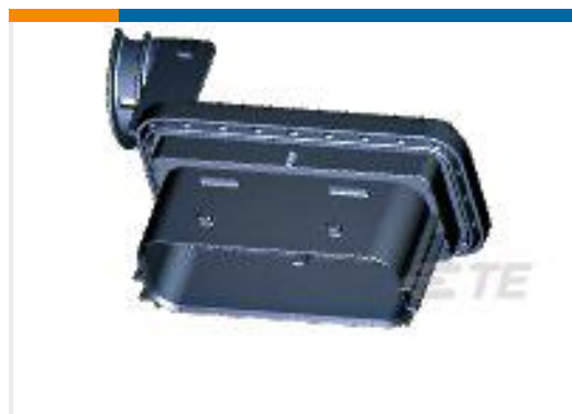
TE 产品编号2138846-2 CAP ASSY, 28 POS, KEY B, AMPSEAL 16 HL