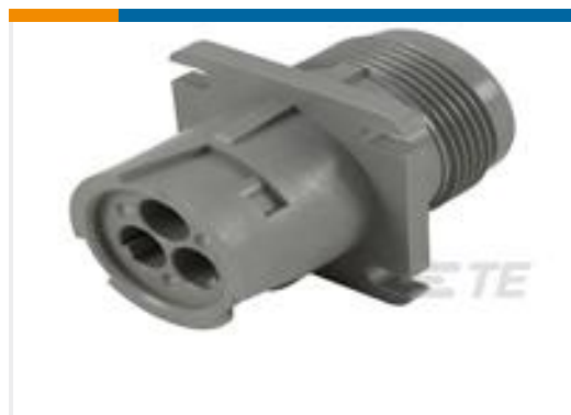
TE 产品编号HD10-3-96P SQ FG REC ASM