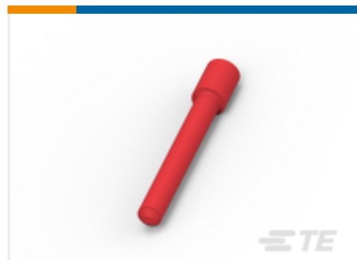
TE 产品编号0413-204-2005 SEALING PLUG, SIZE 20, RED