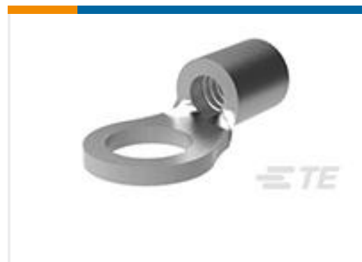
TE 产品编号160121 SOLIS 12-10 R 10MM