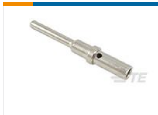
TE 产品编号0460-202-16141 PIN, SOLID, SIZE 16, 16-20AWG, NI