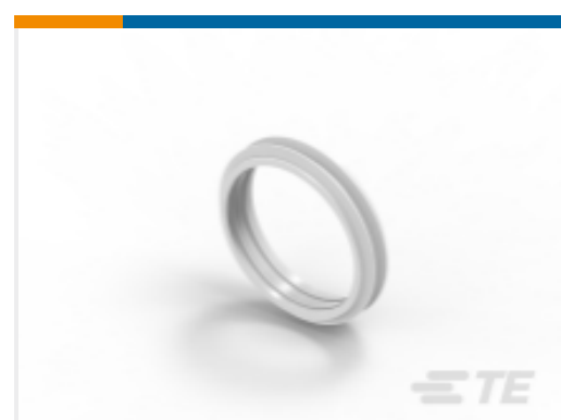
TE 产品编号2309448-3 SWS, PIN DIA 6.0, NAT