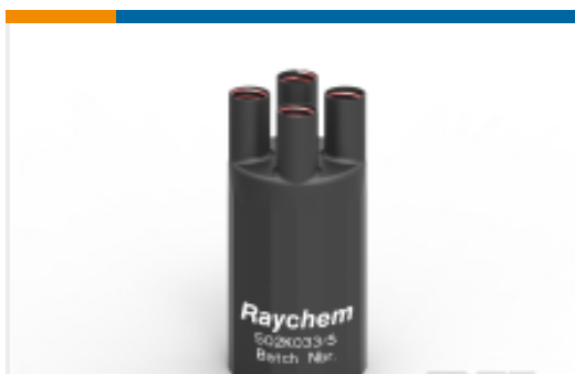
TE 产品编号E00553N001 502K033/S(S15)