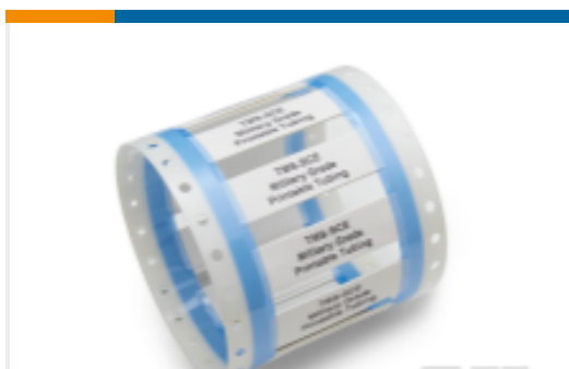
TE 产品编号245965-000 TMS-SCE Military Grade Sleeves