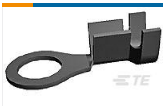
TE 产品编号170225-1 RING TERMINAL