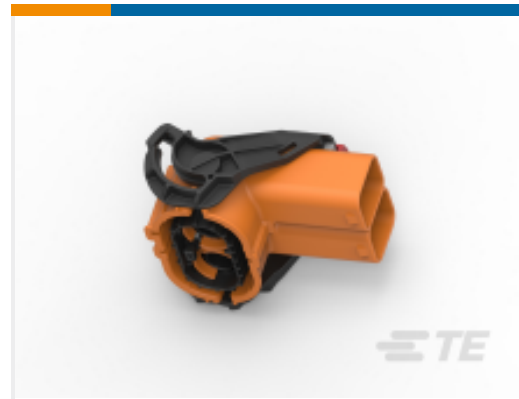
TE 产品编号1-2141154-1 2POS,8MM HV,REC HSG,90DEG,ASSY, SEALED