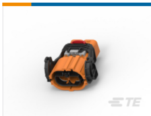
TE 产品编号1-2177053-2 2POS,8MM HV,PLUG HSG,ASSY, SEALED