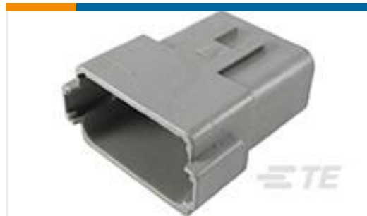
TE 产品编号DT04-12PA-C015 REC, 12P, GRY, E, A