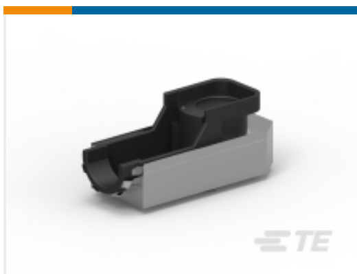
TE 产品编号2137722-1 LOWER INSERT ASSY