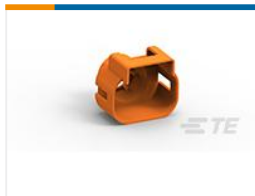
TE 产品编号2103013-1 CABLE SEAL RETAINER, SIZE 1, HVA280