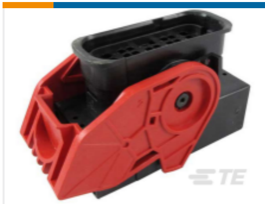
TE 产品编号SRK06-MDA-32A-001 PLG, 32P, BLK, E, A