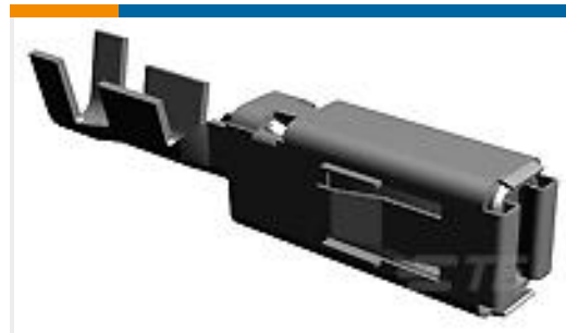
TE 产品编号1-968853-3 AMP MCP 2.8, CONTACT