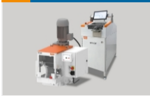
高压线束加工设备(9)