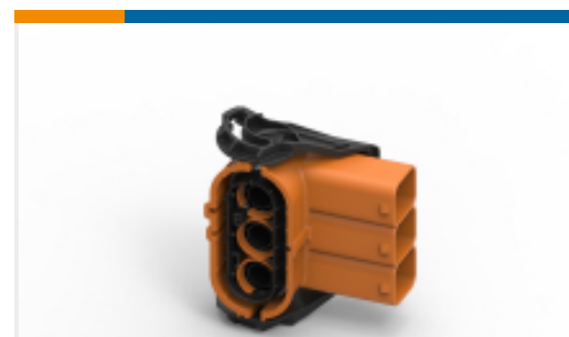
TE 产品编号1-2141166-1 3POS, 8MM HV, REC HSG, 90DEG, ASSY, SEALED