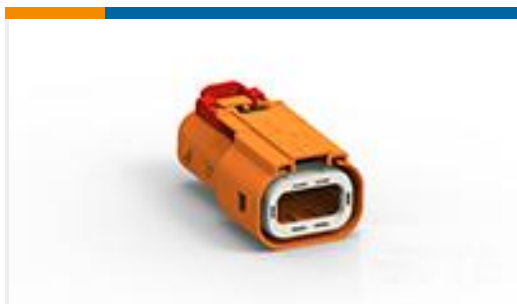
TE 产品编号4-2103015-1 PLUG SUBASSY, A, HVA280-2PHM F