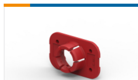
TE 产品编号2141613-4 CARRIER, SEAL, RD