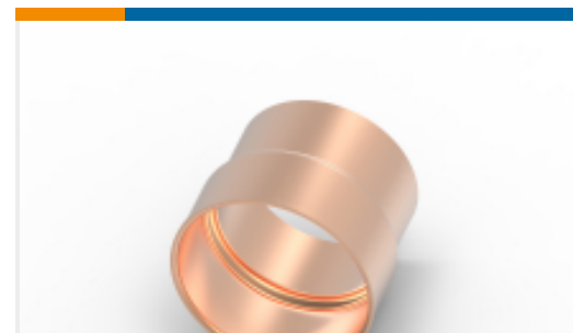
TE 产品编号9-2141157-1 SHIELD CRIMP FERRULE, 90DEG