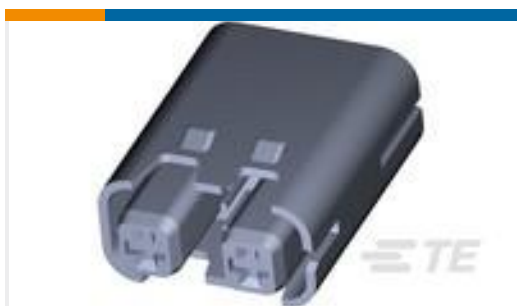
TE 产品编号1587985-1 INNER HSG SUBASSY, HVA280-2PHM