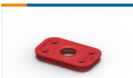
TE 产品编号2141612-4 RADIAL SEAL 25 X 43, CABLE SEAL, RD