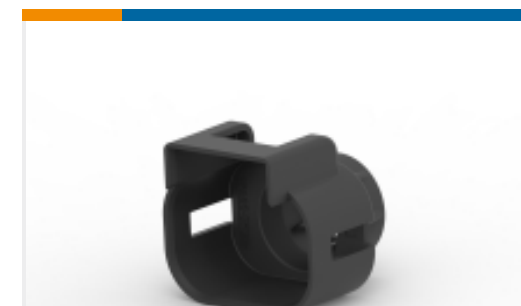
TE 产品编号2103013-2 CABLE SEAL RETAINER, SIZE 2, BK, HVA280