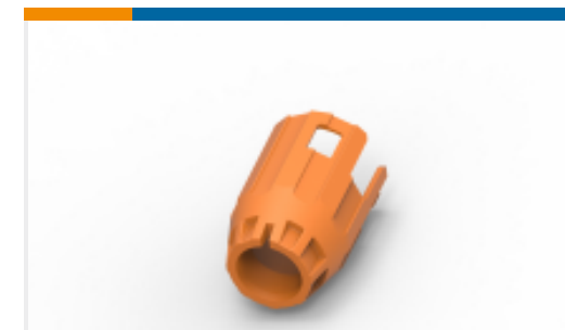
TE 产品编号2141159-1 FINGER PROT CAP 8MM HV, 90DEG