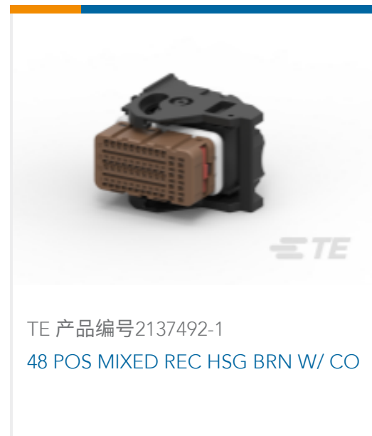
TE 产品编号2137492-1 48 POS MIXED REC HSG BRN W/ CO