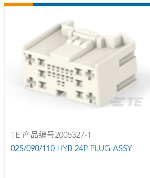
TE 产品编号2005327-1 025/090/110 HYB 24P PLUG ASSY