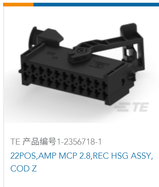
TE 产品编号1-2356718-1 22POS,AMP MCP 2.8,REC HSG ASSY, COD Z