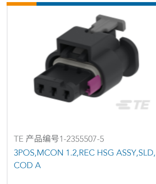
TE 产品编号1-2355507-5 3POS,MCON 1.2,REC HSG ASSY,SLD, COD A