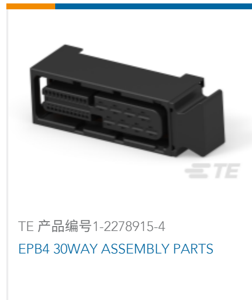
TE 产品编号1-2278915-4 EPB4 30WAY ASSEMBLY PARTS