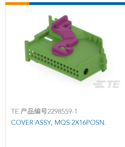
TE 产品编号2298559-1 COVER ASSY, MQS 2X16POSN.