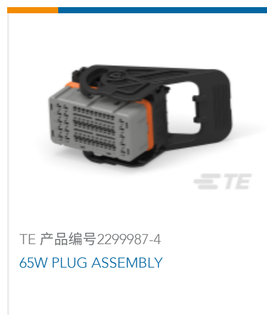
TE 产品编号2299987-4 65W PLUG ASSEMBLY