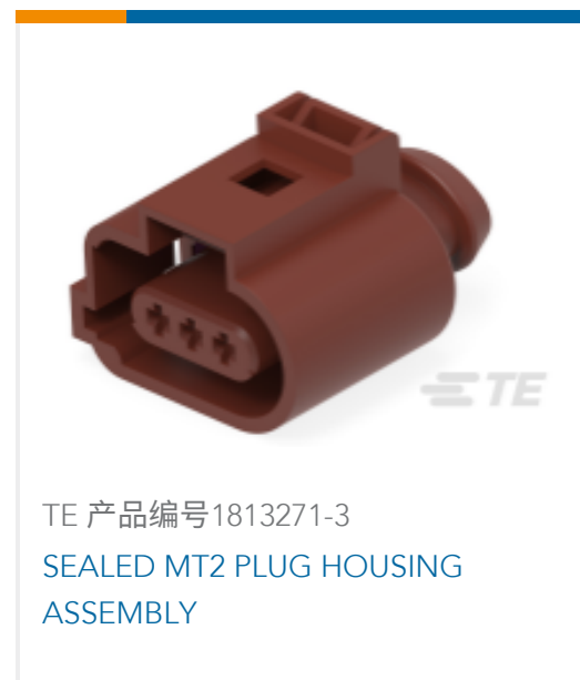
TE 产品编号1813271-3 SEALED MT2 PLUG HOUSING ASSEMBLY