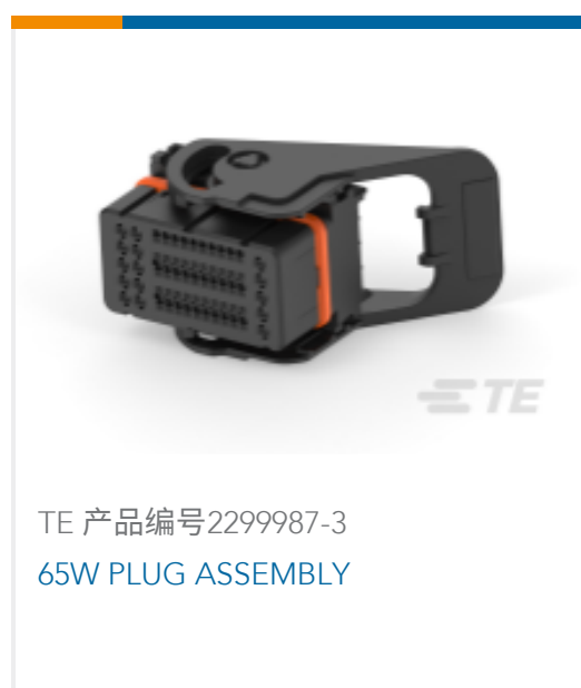
TE 产品编号2299987-3 65W PLUG ASSEMBLY