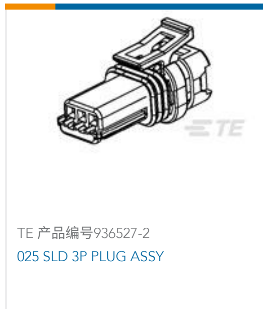
TE 产品编号936527-2 025 SLD 3P PLUG ASSY