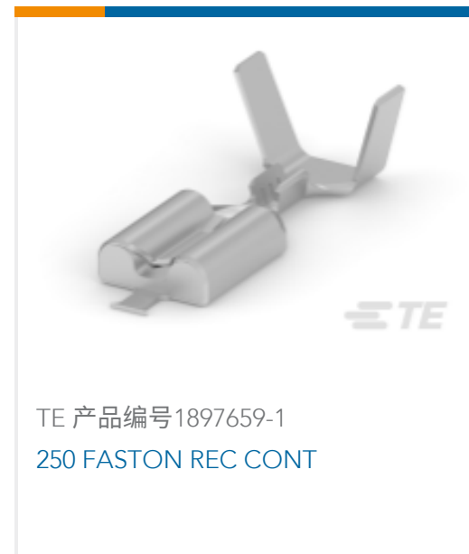
TE 产品编号1897659-1 250 FASTON REC CONT