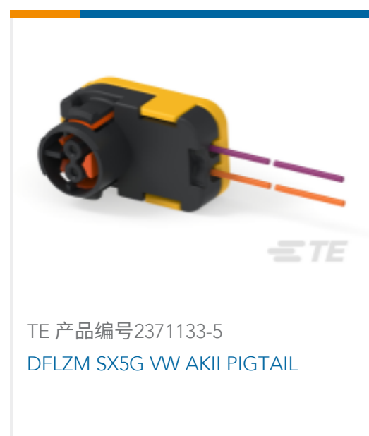
TE 产品编号2371133-5 DFLZM SX5G VW AKII PIGTAIL