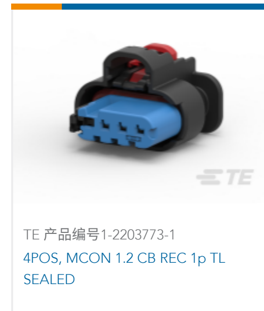
TE 产品编号1-2203773-1 4POS, MCON 1.2 CB REC 1p TL SEALED