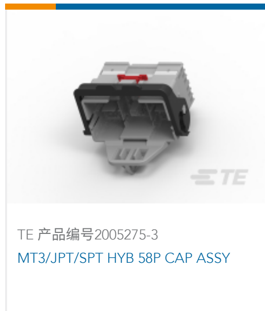
TE 产品编号2005275-3 MT3/JPT/SPT HYB 58P CAP ASSY