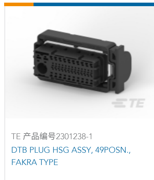
TE 产品编号2301238-1 DTB PLUG HSG ASSY, 49POSN., FAKRA TYPE