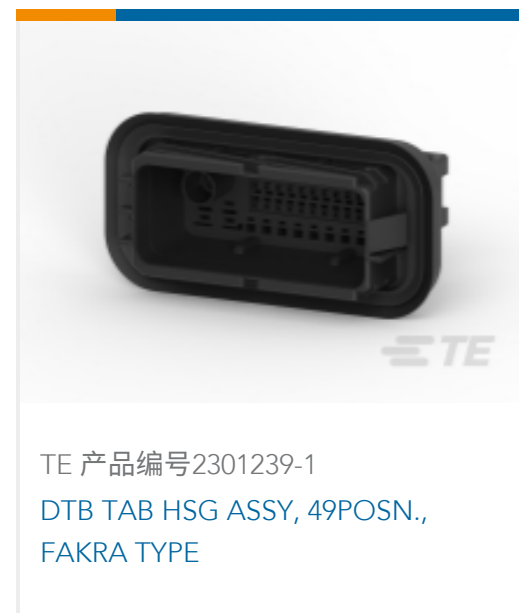
TE 产品编号2301239-1 DTB TAB HSG ASSY, 49POSN., FAKRA TYPE