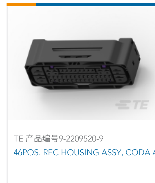
TE 产品编号9-2209520-9 46POS. REC HOUSING ASSY, CODA A