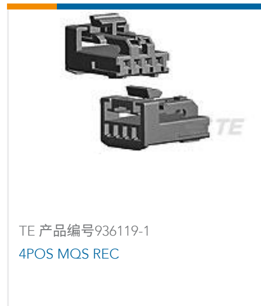
TE 产品编号936119-1 4POS MQS REC