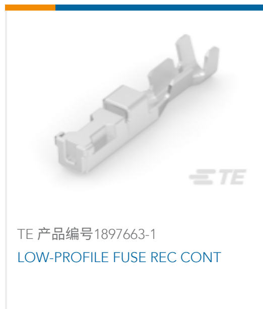
TE 产品编号1897663-1 LOW-PROFILE FUSE REC CONT