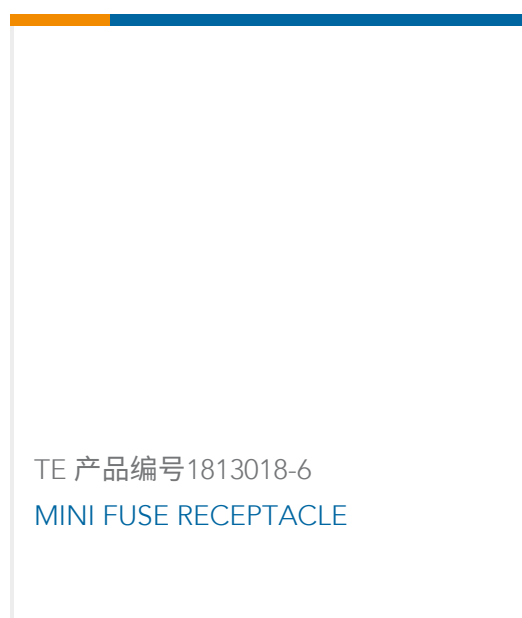
TE 产品编号1813018-6 MINI FUSE RECEPTACLE