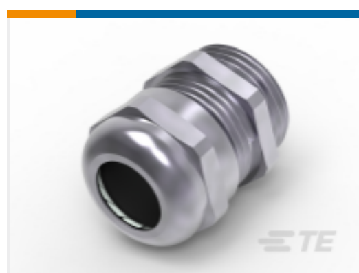
TE 产品编号T3609200102-000 DLX-20-M