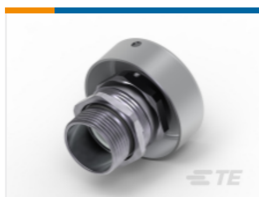
TE 产品编号T3900250250-000 M25X1.5 VA-25-LM