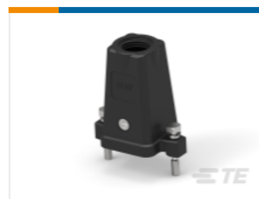
TE 产品编号T1926030116-009 H3APR-TGC-M16-EMC-C