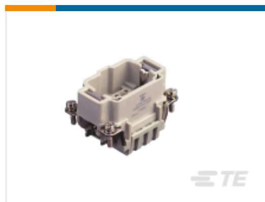
TE 产品编号T2040064101-000 HE-006-MC