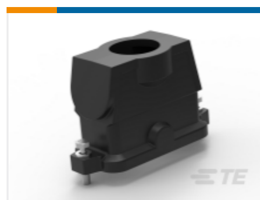
TE 产品编号T1922160140-000 H16BPR-TGHC-M40