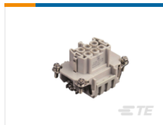
TE 产品编号T2040064201-000 HE-006-FC