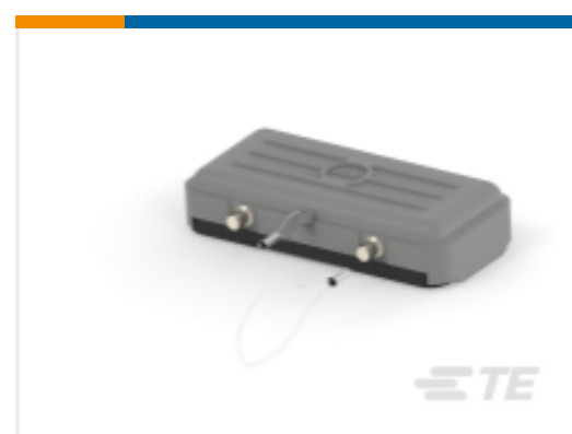
TE 产品编号T1010161600-000 H16B-KDTP-BO