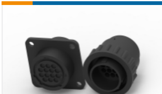
TE 产品编号183039-1 欧洲、中东和非洲 CPC