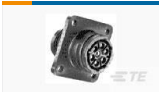
TE 产品编号211773-1 23-19 CPC RECEIPT REV SEX