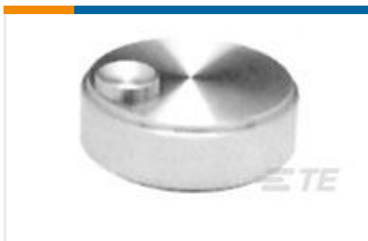
TE 产品编号3-1437622-8 KN1751BS1/4=KNOB SPINNER L/HAI