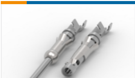
TE 产品编号1-66099-5 Pin and Socket Contacts, Type III, LP