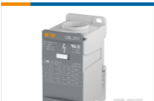
TE 产品编号1SNL325010R0000 DBL250