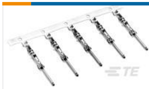
TE 产品编号66098-9 III+ PIN,18-16,30AU/FL,STRIP