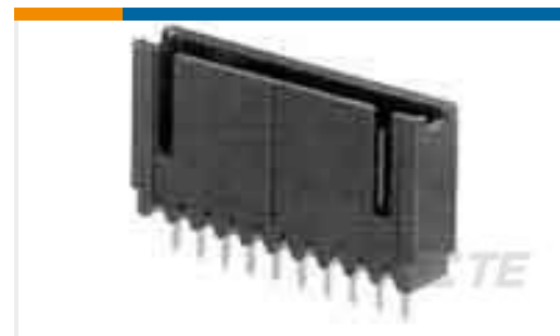
TE 产品编号6-102202-3 16 MODII HDR SRST SHRD LF