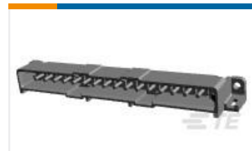
TE 产品编号207599-7 MMATE PIN HDR ASSY,16P LF