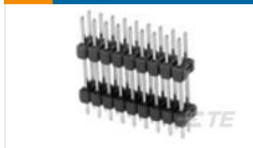
TE 产品编号1-829822-0 2X10P MOD2 STIFTLEI