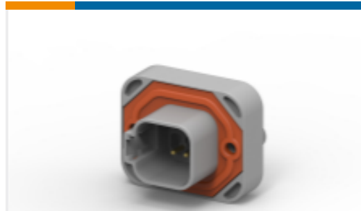
TE 产品编号DT15-6P-GP01 HDR, 6P, GRY, ST, 5 PSI, AU/NI/CU