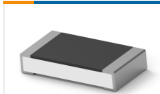
TE 产品编号6-2176387-2 RQ 1206 576K 0.1% 10PPM 1K RL