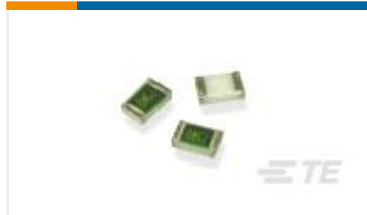
TE 产品编号1676649-1 RN 0805 13R 0.1% 10PPM CUT LENGTH