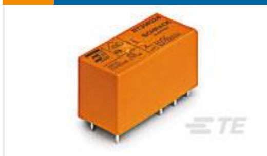
TE 产品编号2-1393238-1 RTB14048