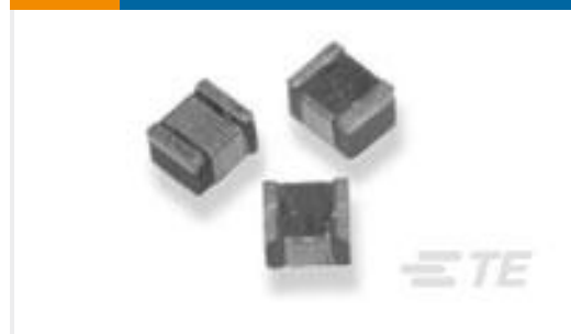
TE 产品编号1-2176086-1 3654 0402 5.1nH 5% 2K RL