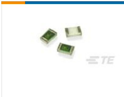
TE 产品编号4-2176091-1 RP 2A 0.25W 150R 0.1% 25PPM 1K RL