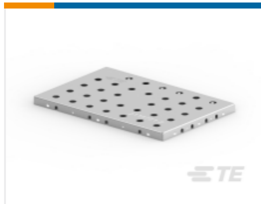
TE 产品编号2118721-2 STD SHIELD COVER, CRS-38.60X25.90X2.00MM