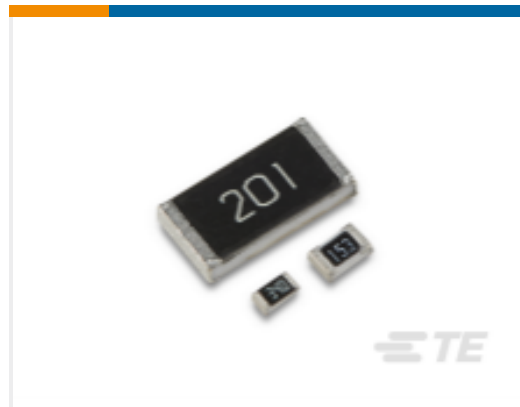
TE 产品编号4-2176325-9 CRGP 0402 100K 1%