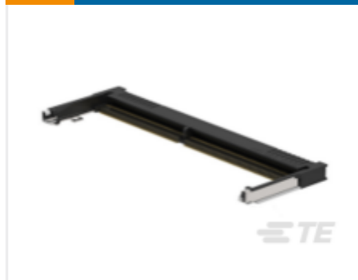
TE 产品编号2309411-1 DDR4 SO DIMM Sockets