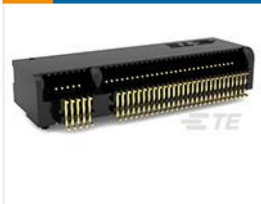
TE 产品编号2199230-4 M.2 0.5PITCH 4.2H KEY E 15U" AU