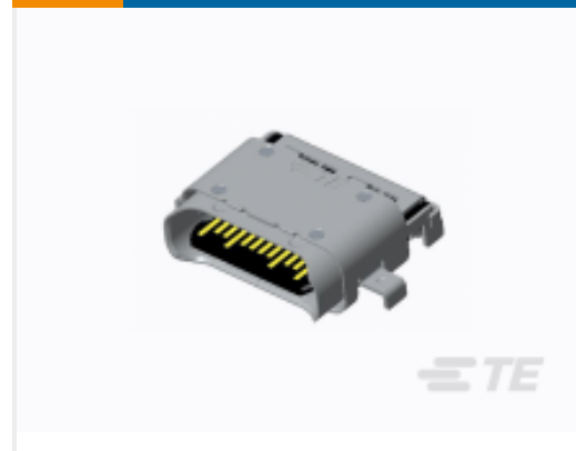
TE 产品编号1-2295018-2 USB TYPE C, REC OFFSET 0.65MM DUAL SMT