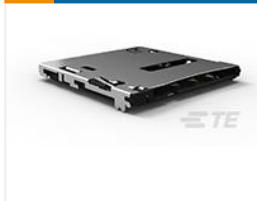
TE 产品编号2174803-2 PUSH-PUSH MICRO SIM CONNECTOR