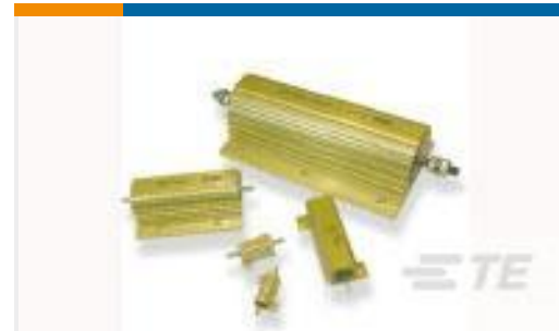
TE 产品编号1630019-7 HSC200 180R 5%