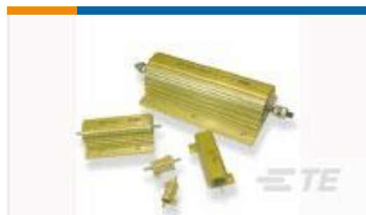
TE 产品编号3-1630027-6 HSC300 200R 5%