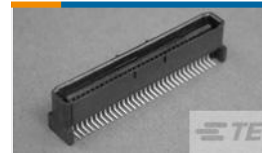
TE 产品编号1-5146888-1 1FHP,64,50A/S,S,C,S10,12,13,15