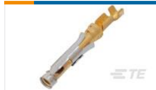
TE 产品编号66104-9 III+ SKT,24-20,30AU/FL,STRIP