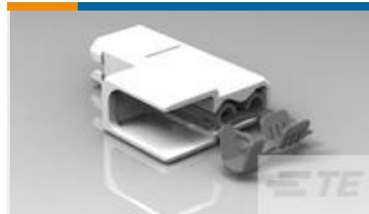
TE 产品编号521600-2 ULTRA-POD 187 ASY REC 22-18 AWG TPBR