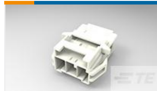
TE 产品编号1-1971772-3 PTL 1X3 CAP PANEL MT STD TEMP KEY A NAT