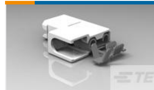
TE 产品编号521411-2 ULTRA-POD 250 ASY REC 22-18 AWG TPBR