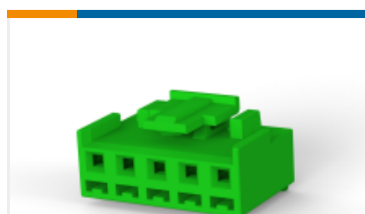
TE 产品编号1744495-5 05P EP-II HOUSING, GREEN