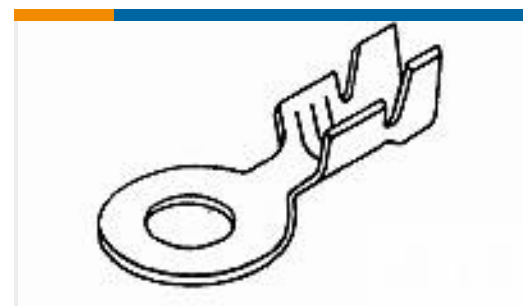
TE 产品编号42722-1 RING TONGUE 12-10 AWG BR