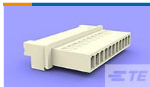
TE 产品编号1969588-2 HSG, REC, FREE-HANGING, SINGLE ROW,EP2.5