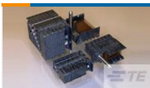
TE 产品编号 2132570-1 IMP1000,HMP,V3P6C,LG,REW46,4.9