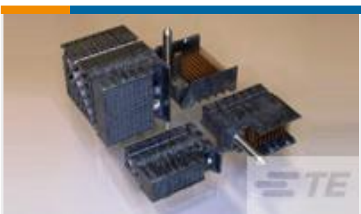
TE 产品编号 2132562-2 IMP100O,HMP,V3P6C,LG,REW39,5.5