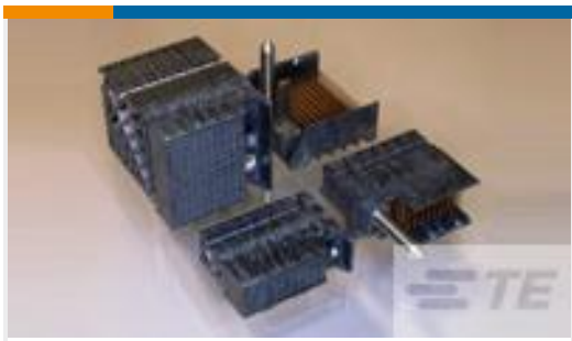
TE 产品编号 2132564-1 IMP100O,HMP,V3P6C,RG,LEW39,4.9