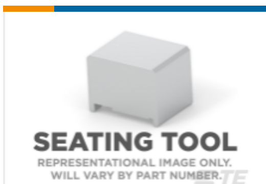
TE 产品编号 2018770-1 TL, SEAT, 3PR 6 COL ORTHOGONAL