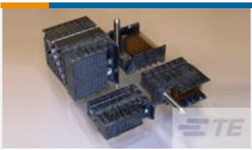
TE 产品编号 2132564-2 IMP100O,HMP,V3P6C,RG,LEW39,5.5