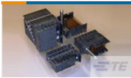
TE 产品编号 2132563-2 IMP100O,HMP,V3P6C,RG,OEW39,5.5