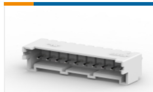
TE 产品编号1-1969730-0 EP2.5 SHROUDED HDR ASSY 10P VERTICAL