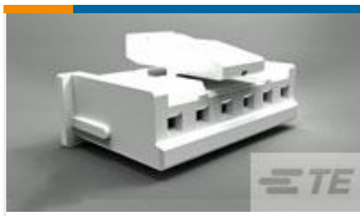
TE 产品编号1-1744417-2 12 POS EP 2.5 HSG, GLOW WIRE