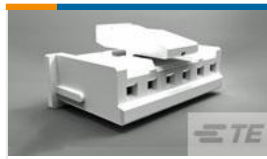
TE 产品编号1-1744417-8 8 POS EP 2.5 HSG, GLOW WIRE