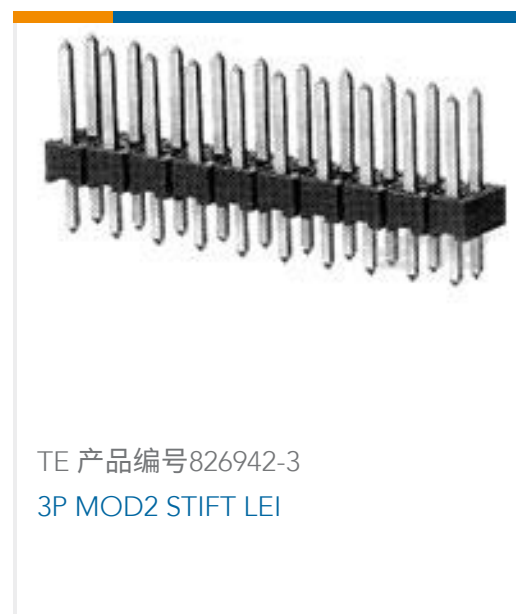
TE 产品编号826942-3 3P MOD2 STIFT LEI