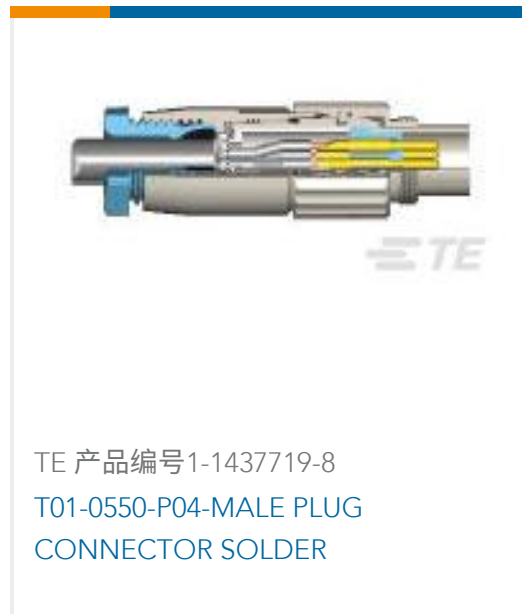
TE 产品编号1-1437719-8 T01-0550-P04-MALE PLUG CONNECTOR SOLDER