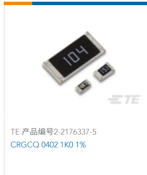
TE 产品编号2-2176337-5 CRGCQ 0402 1K0 1%