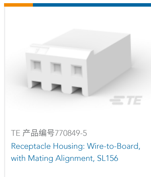
TE 产品编号770849-5 Receptacle Housing: Wire-to-Board, with Mating Alignment, SL156