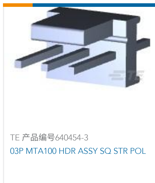
TE 产品编号640454-3 03P MTA100 HDR ASSY SQ STR POL