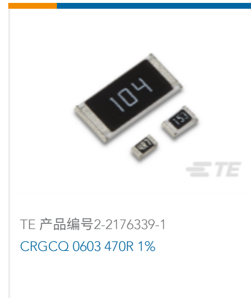
TE 产品编号2-2176339-1 CRGCQ 0603 470R 1%