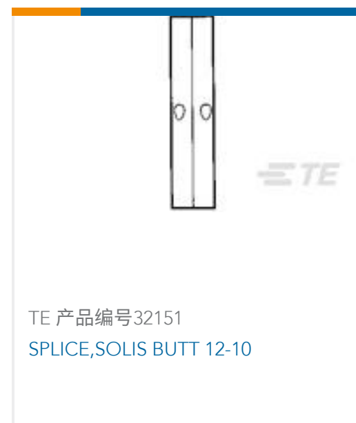
TE 产品编号32151 SPLICE,SOLIS BUTT 12-10