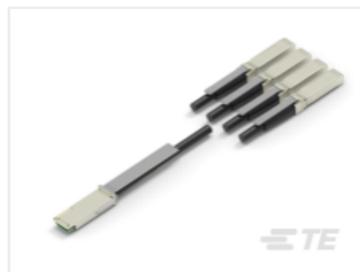
TE 产品编号 2053453-5 C/A, QSFP TO 4XSFP+, 4.0M