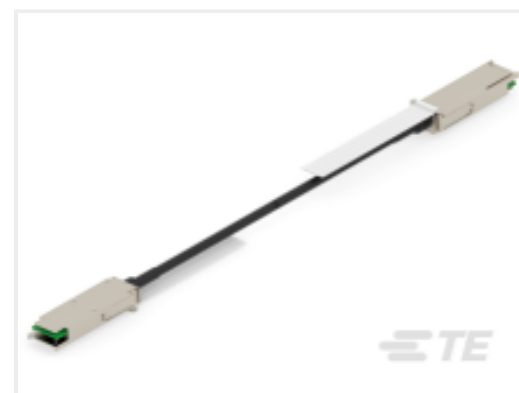
TE 产品编号 1-2053638-6 C/A, QSFP, 0.5M, P1-P2, UNEQUALIZED