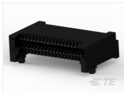
TE 产品编号 2110819-1 QSFP+ Enh EVERCLEAR PT Conn