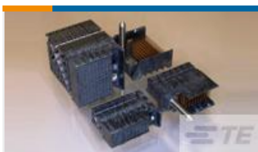
TE 产品编号 2057991-1 IMP100S,R,RA6P14C,UG,39