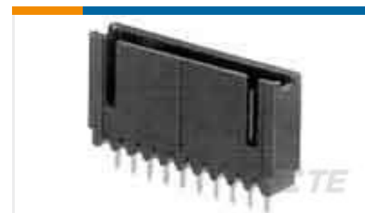
TE 产品编号5-826936-0 AMP AMPMODU II PIN HDR.