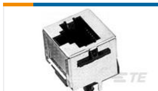
TE 产品编号5557969-1 MJ,TE,8P/8C,SHLD,PNL STOPS&G