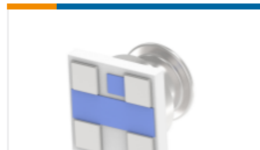
TE 产品编号MS5837-30BA01-50 MS5837-30BA01 30BA T&R PRESSURE SEN