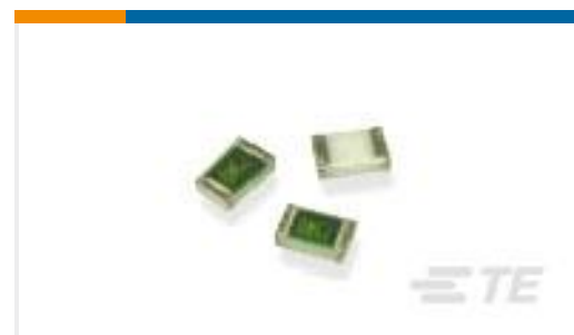
TE 产品编号1-2176091-8 RP 2A 0.25W 86R6 0.1% 25PPM 1K RL