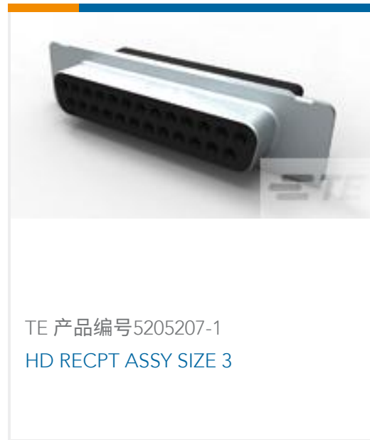
TE 产品编号5205207-1 HD RCPT ASSY SIZE 3