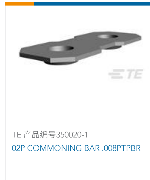
TE 产品编号350020-1 02P COMMONING BAR .008PTPBR