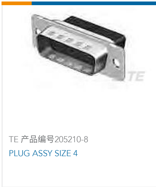
TE 产品编号205210-8 PLUG ASSY SIZE 4