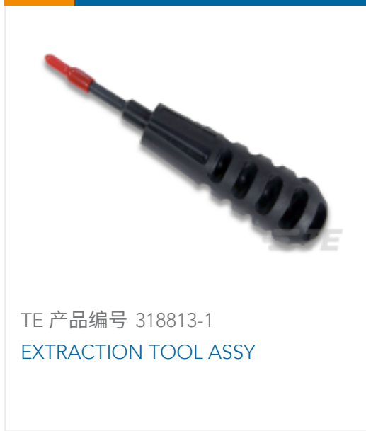
TE 产品编号 318813-1 EXTRACTION TOOL ASSY