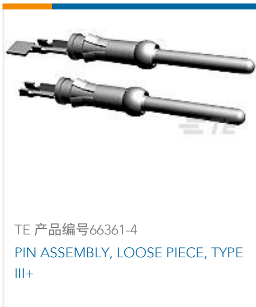
TE 产品编号66361-4 PIN ASSEMBLY, LOOSE PIECE, TYPE III+