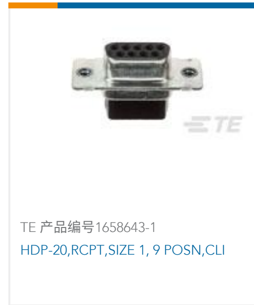
TE 产品编号1658643-1 HDP-20,RCPT,SIZE 1, 9 POSN,CLI