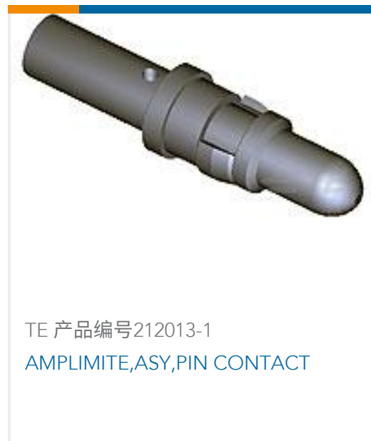
TE 产品编号212013-1 AMPLIMITE,ASY,PIN CONTACT