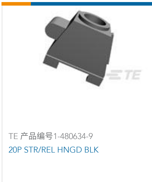
TE 产品编号1-480634-9 20P STR/REL HNGD BLK