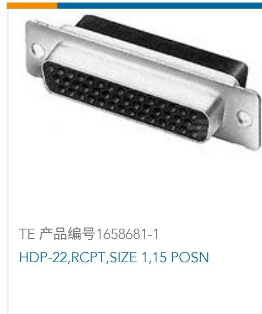
TE 产品编号1658681-1 HDP-22,RCPT,SIZE 1,15 POSN