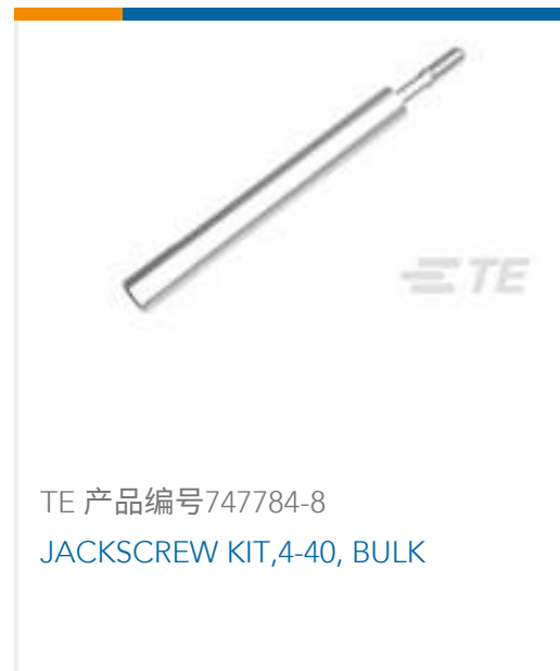
TE 产品编号747784-8 JACKSCREW KIT,4-40, BULK