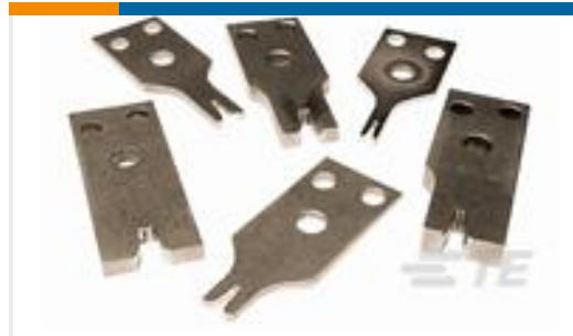
TE 产品编号1-456405-5 CRIMPER, WIRE .080 "F"