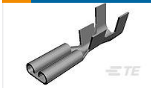
TE 产品编号41449 250 FASTON REC 14-10 AWG BR