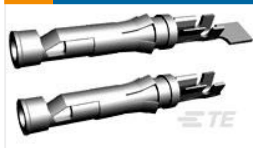
TE 产品编号66358-5 III+ SKT, 18-14, 30AU >10, STRIP