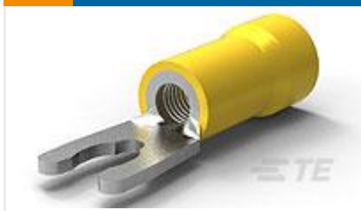
TE 产品编号53247-2 TERMINAL, PG SPR SPD 12-10 8