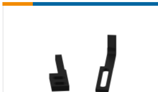
TE 产品编号240639-1 STRIPPER *1