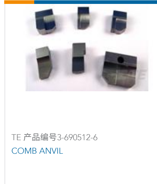
TE 产品编号3-690512-6 COMB ANVIL