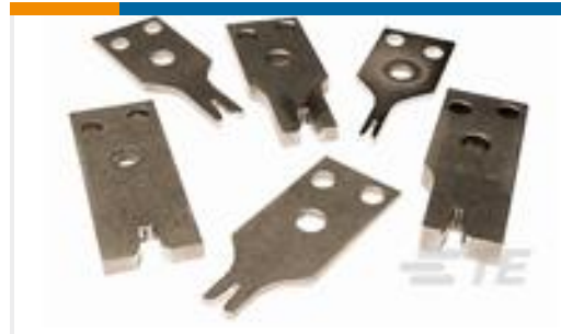
TE 产品编号9-1633609-4 CRIMPER, WIRE F