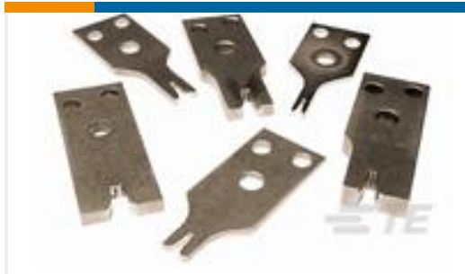
TE 产品编号4-456401-4 CRIMPER, WIRE .042 F PREMIUM