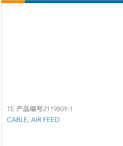
TE 产品编号2119809-1 CABLE, AIR FEED