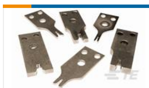
TE 产品编号2119785-2 CRIMPER, INSUL OVERLAP PREM