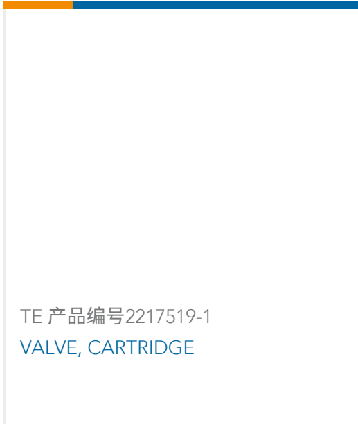
TE 产品编号2217519-1 VALVE, CARTRIDGE