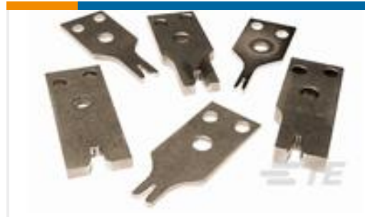
TE 产品编号5-657555-6 DRAHTCRIMPER