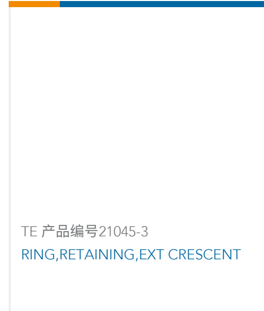
TE 产品编号21045-3 RING, RETAINING, EXT CRESCENT