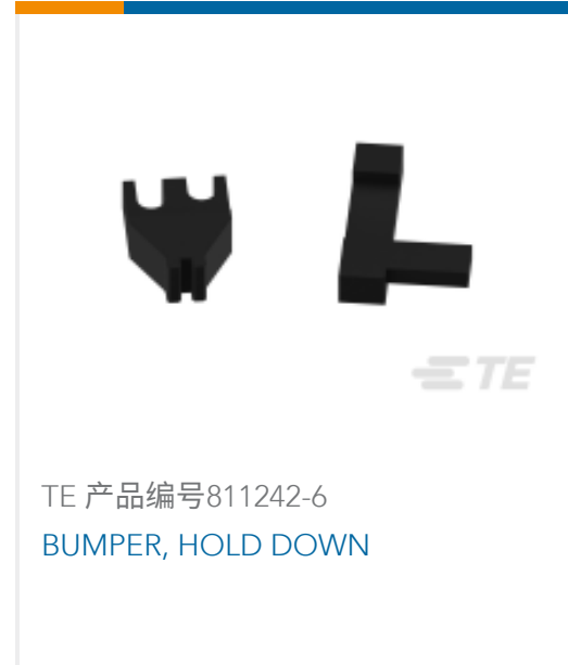
TE 产品编号811242-6 BUMPER, HOLD DOWN