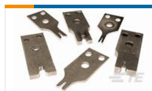
TE 产品编号1-2119785-6 CRIMPER, INSUL OVERLAP PREM