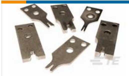
TE 产品编号1633996-4 CRIMPER, INSUL SPECIAL