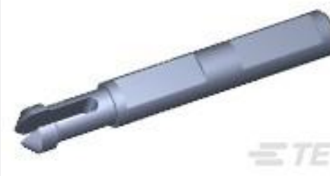
TE 产品编号770377-1 UMNL II KEYING PLUG