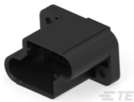
TE 产品编号 211759-1 RECEPT HSG,12 POSN,METRIMATE