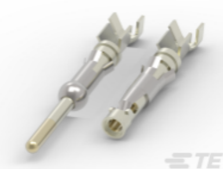
TE 产品编号66104-8 Strip Pin and Socket Contacts, Type III