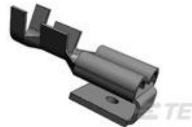
TE 产品编号1-280079-2 250 FASTON,REC.,14-17AWG,TPBR