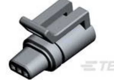
TE 产品编号1879980-1 MINI SUPERSEAL CONNECTOR