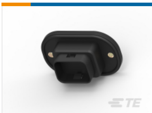
TE 产品编号1823444-1 ADAPTER, FOR A-PILLAR, ASSY