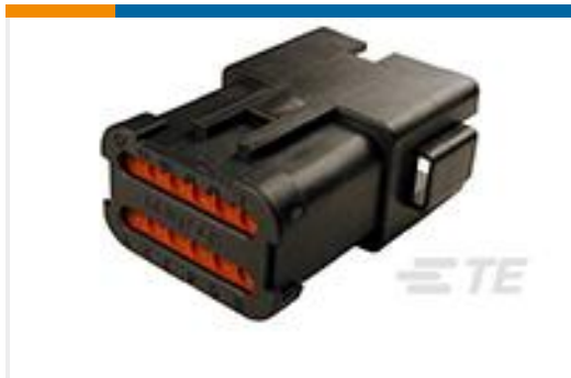
TE 产品编号DT04-12PA-BE03 REC, 12P, BLK, N, ENH KEY, CAP, A