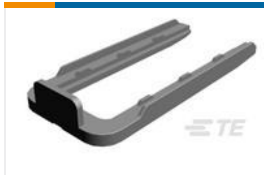
TE 产品编号1718328-1 FIXING SLIDE