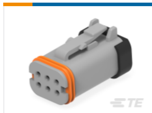
TE 产品编号DT16-6SA-KP01 PLG, 6P, GRY, E, A