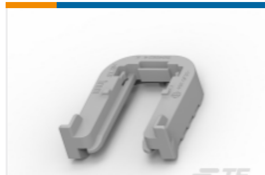
TE 产品编号1564562-4 SLIDE, TAB HSG GROUP D