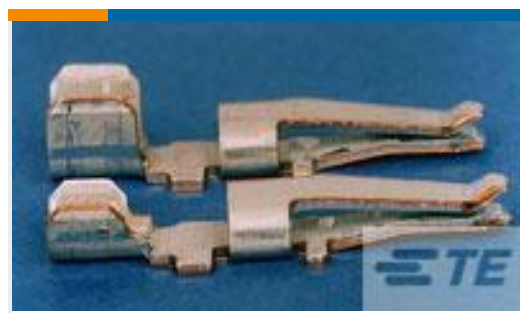
TE 产品编号556136-1 CONT, AMP INNRGY WTW, STRIP, 10-12