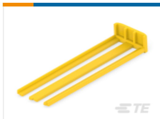
TE 产品编号2327845-1 95POS, MCON 1.2, SECONDARY LOCKING