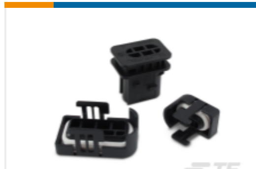
TE 产品编号2112300-1 重型密封系列连接器保护帽