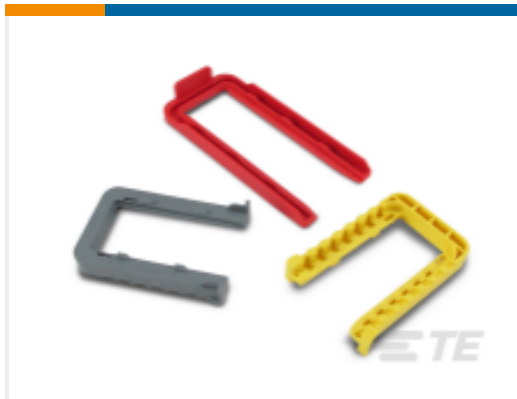
TE 产品编号2112166-2 LEAVYSEAL Locking Slides