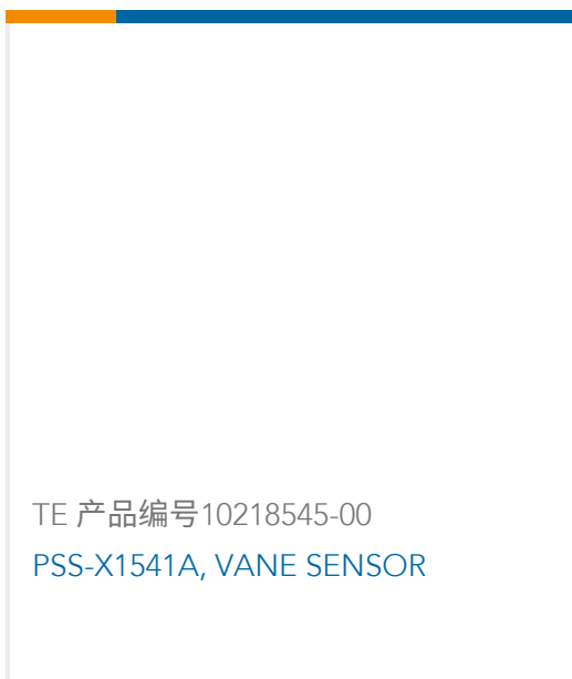
TE 产品编号10218545-00 PSS-X1541A, VANE SENSOR