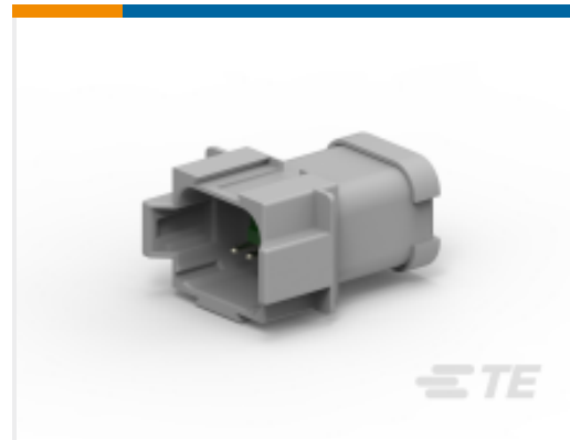
TE 产品编号2298173-1 DT04-08PA-P089, REC, 8P GRY, BUSBAR, 3X2, A