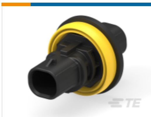
TE 产品编号2325106-2 ADAPTER, 2POS, 1.2X0.6, PIN HSG ASSY