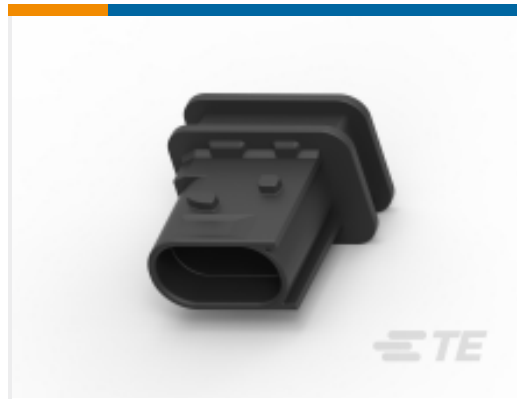
TE 产品编号2112299-1 PROTECTION CAP, FOR REC.HSG GR