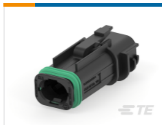
TE 产品编号9-2367337-1 2POS, CSS SIZE 20, SOC OUTER HSG ASSY, SLD