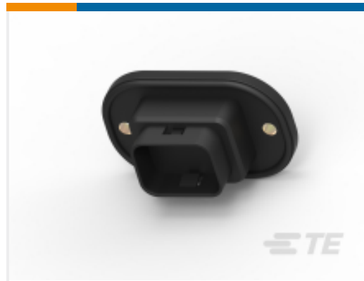
TE 产品编号1823444-1 ADAPTER, FOR A-PILLAR, ASSY