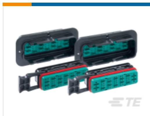
TE 产品编号2500002-1 SRC Pwr 24+14ACDEG Female Recp Hsg Assy