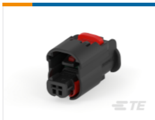
TE 产品编号2345284-2 2POS, MCON 1.2, REC HSG ASSY, SLD, COD B