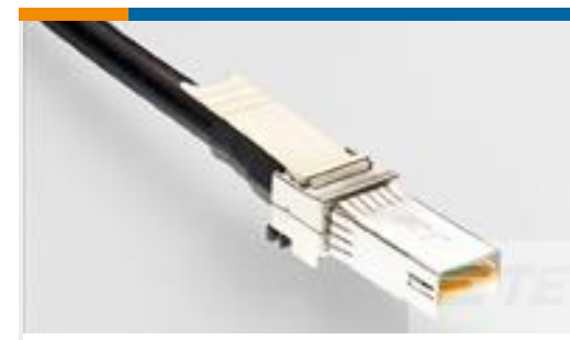
TE 产品编号 2142970-6 CABLE ASSY, MICRO SFP+ TO STD SFP+, 5M