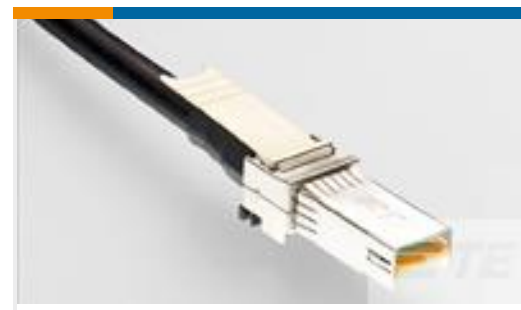
TE 产品编号 2142970-5 CABLE ASSY, MICRO SFP+ TO STD SFP+, 4M