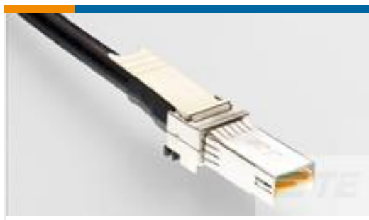
TE 产品编号 2142970-3 CABLE ASSY, MICRO SFP+ TO STD SFP+, 2M