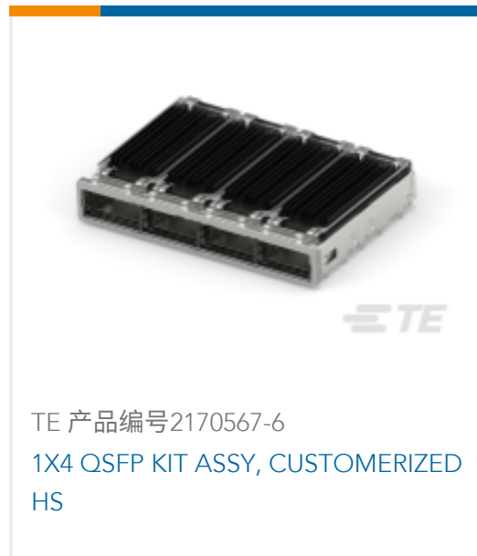
TE 产品编号2170567-6 1X4 QSFP KIT ASSY, CUSTOMERIZED HS