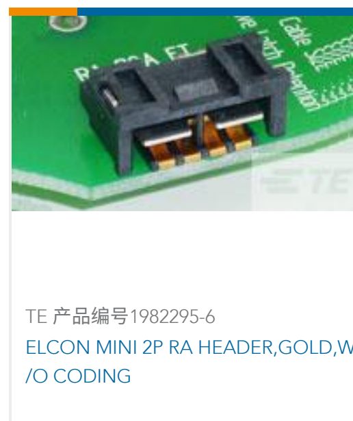
TE 产品编号1982295-6 ELCON MINI 2P RA HEADER, GOLD, W/O CODING