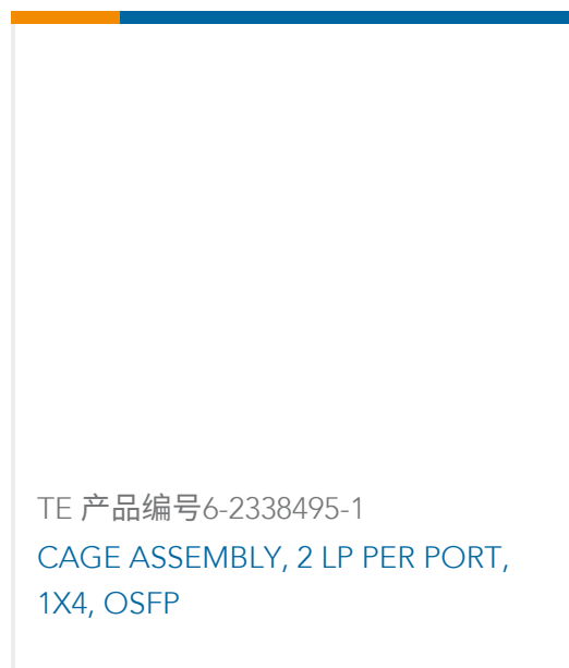
TE 产品编号6-2338495-1 CAGE ASSEMBLY, 2 LP PER PORT, 1X4, QSFP