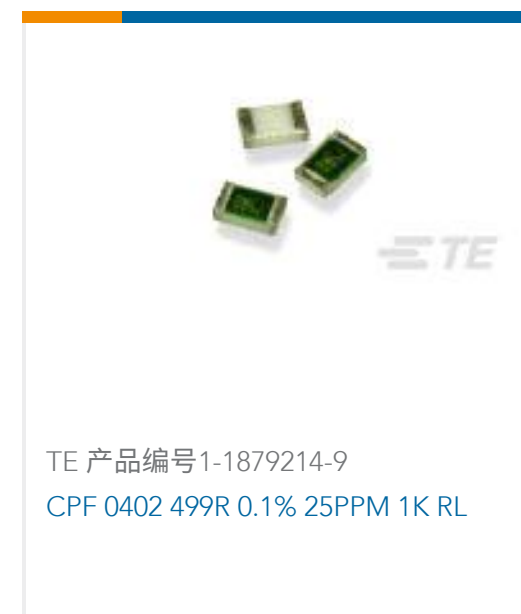
TE 产品编号1-1879214-9 CPF 0402 499R 0.1% 25PPM 1K RL