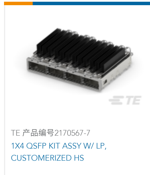
TE 产品编号2170567-7 1X4 QSFP KIT ASSY W/ LP, CUSTOMERIZED HS