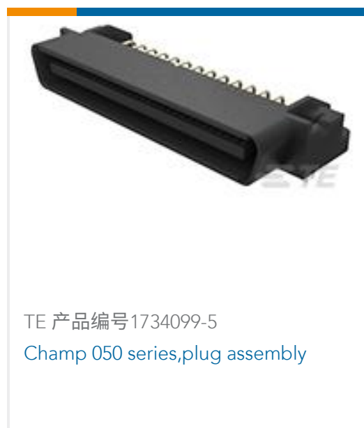
TE 产品编号1734099-5 Champ 050 series, plug assembly