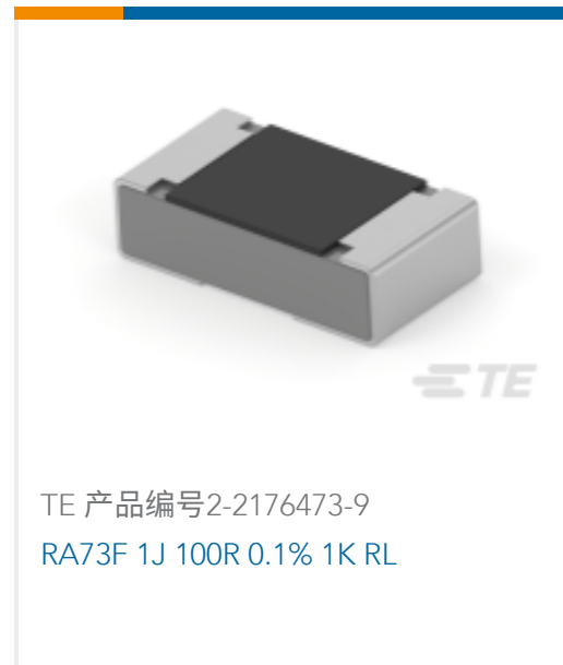
TE 产品编号2-2176473-9 RA73F 1J 100R 0.1% 1K RL