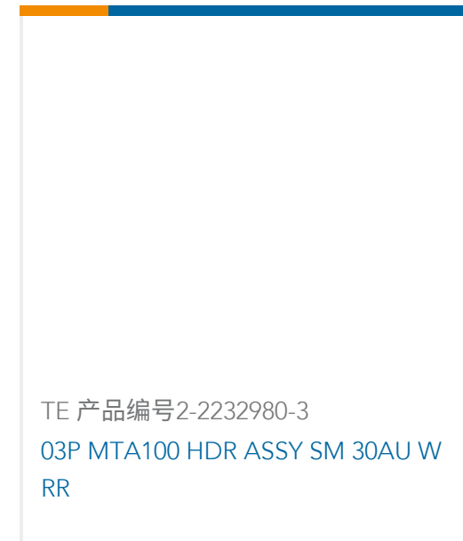
TE 产品编号2-2232980-3 03P MTA100 HDR ASSY SM 30AU WRR