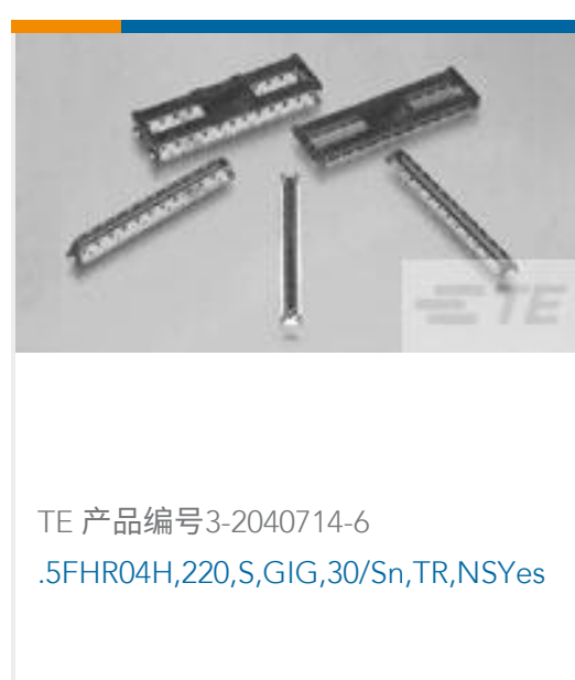
TE 产品编号3-2040714-6 .5FHR04H,220,S,GIG,30/Sn,TR,NSYes