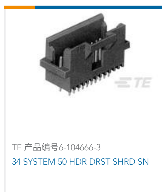
TE 产品编号6-104666-3 34 SYSTEM 50 HDR DRST SHRD SN