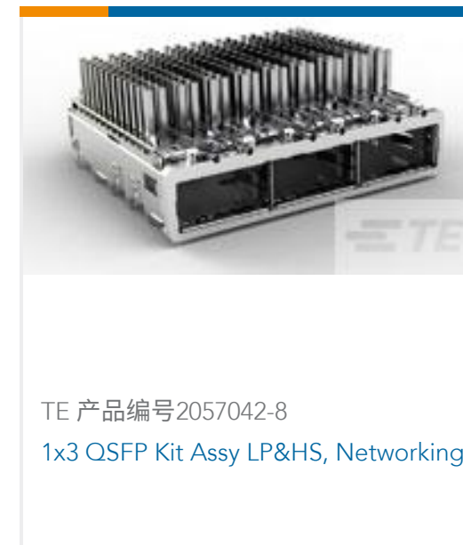
TE 产品编号2057042-8 1x3 QSFP Kit Assy LP&HS, Networking