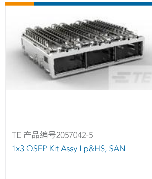
TE 产品编号2057042-5 1x3 QSFP Kit Assy Lp&HS, SAN