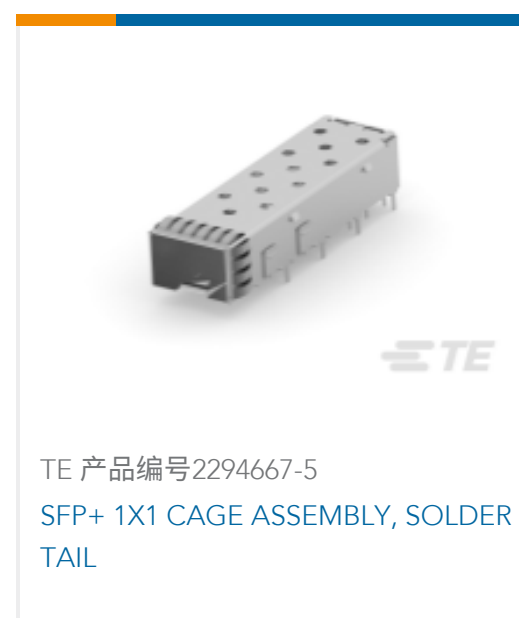
TE 产品编号2294667-5 SFP+ 1X1 CAGE ASSEMBLY, SOLDER TAIL