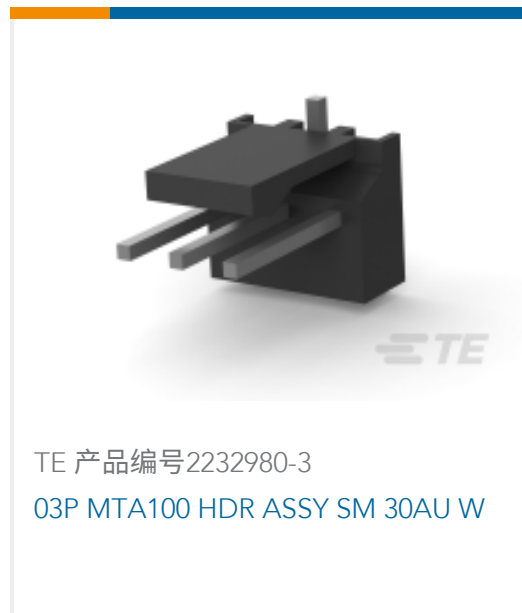
TE 产品编号2232980-3 03P MTA100 HDR ASSY SM 30AU W