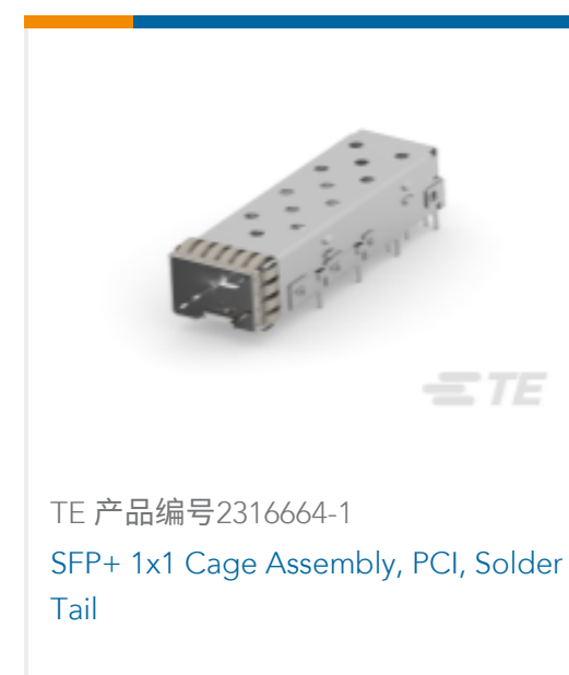
TE 产品编号2316664-1 SFP+ 1x1 Cage Assembly, PCI, Solder Tail