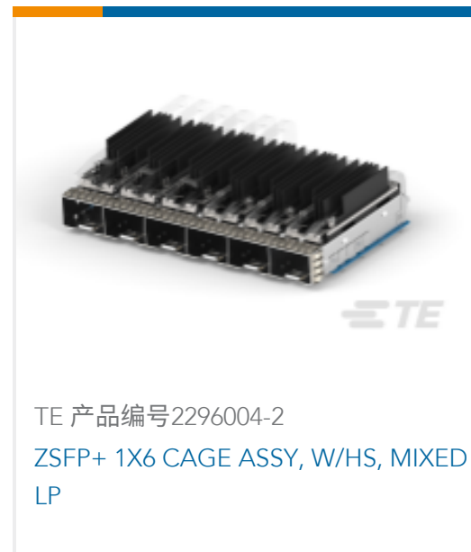
TE 产品编号2296004-2 ZSFP+ 1X6 CAGE ASSY, W/HS, MIXED LP