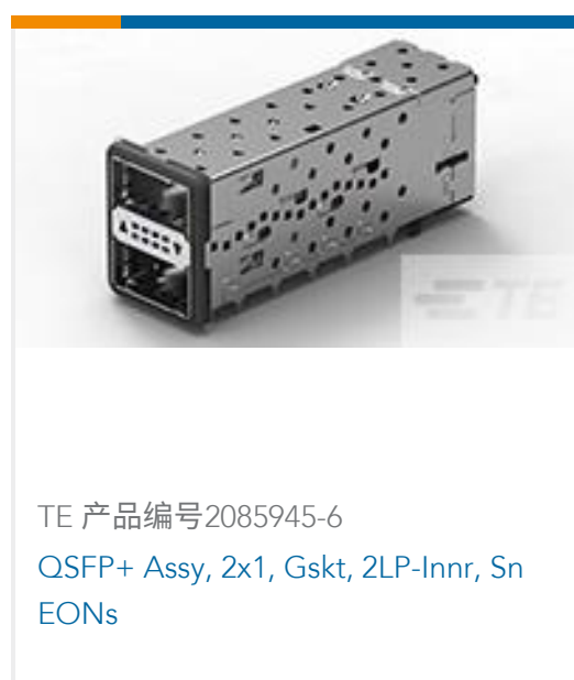
TE 产品编号2085945-6 QSFP+ Assy, 2x1, Gskt, 2LP-Innr, Sn EONs