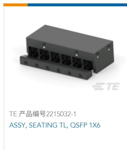
TE 产品编号2215032-1 ASSY, SEATING TL, QSFP 1X6