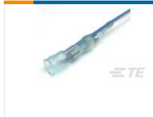
TE 产品编号 840443-000 B-020-42-04