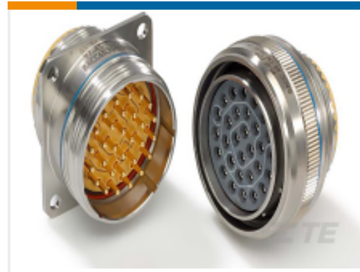
TE 产品编号 ZPF000000000008258 983-6KE 16-24 PN-L