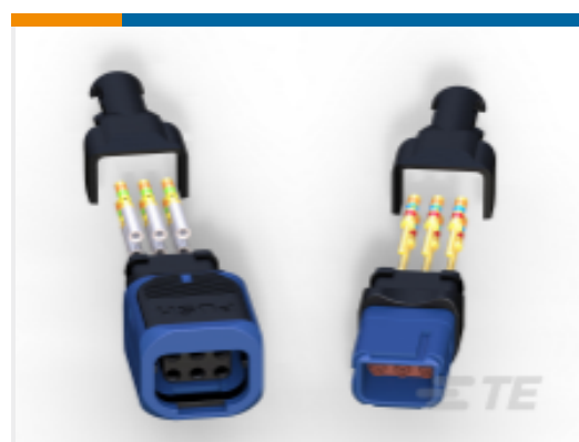
TE 产品编号YD369-R66-AP000000 369 6 WAY REC, NO CONTACTS, PIN