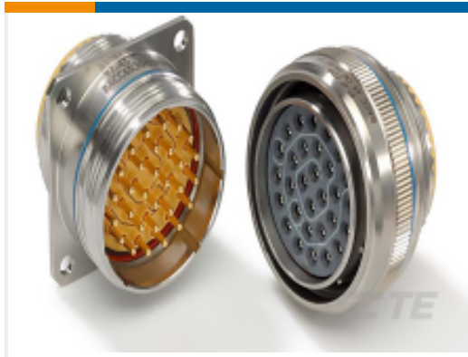
TE 产品编号 ZPF000000000007795 983-0WS 20-25 SN-L