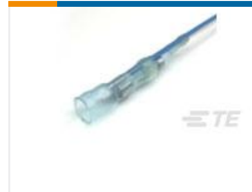
TE 产品编号 709046-000 B-040-22-03