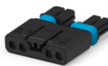
TE 产品编号 2106135-4 Assembly, Free Hanging Plug, SLC, 4 pos