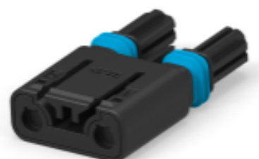
TE 产品编号 2106135-2 Assembly, Free Hanging Plug, SLC, 2 pos