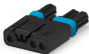
TE 产品编号 2106135-3 Assembly, Plug, 3-Position