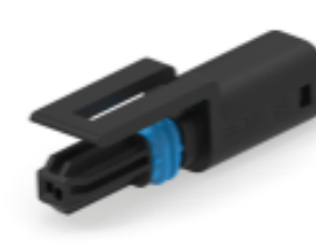
TE 产品编号 2154854-1 SlimSeal Assembly, Plug, 1 position