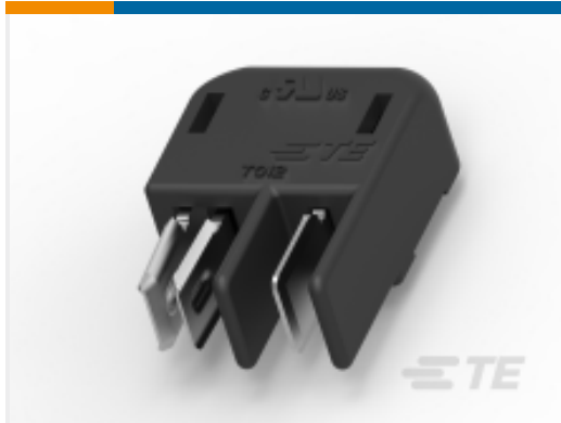
TE 产品编号1-2213504-1 ASSEMBLY, 2 POSITION, BLACK, WITH POS