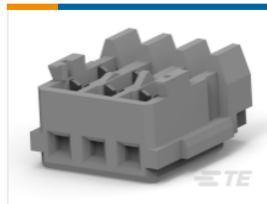
TE 产品编号 353293-3 MINI CT MT REC ASSY 3P GRAY