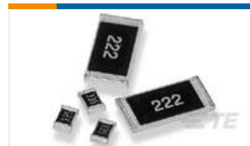
TE 产品编号4-1879494-9 CRGH0603 5% 100R 0.2W