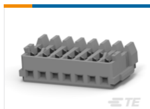
TE 产品编号1-353908-2 Mini 通用端接 (CT) 连接器