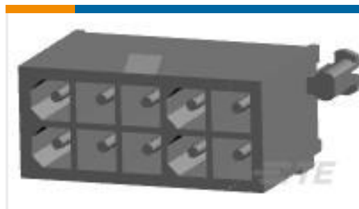
TE 产品编号1-770858-0 10P MINI UMNL HDR ASSY SNDBL L