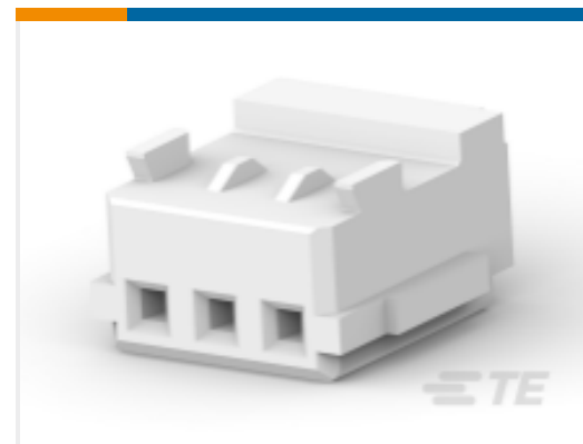
TE 产品编号 353908-3 CT REC HSG 3P CRIMP TYPE WHITE