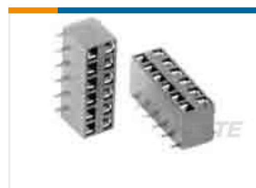
TE 产品编号969973-6 2x6P HV100 REC. CON, SMD, GOLD, BLISTER