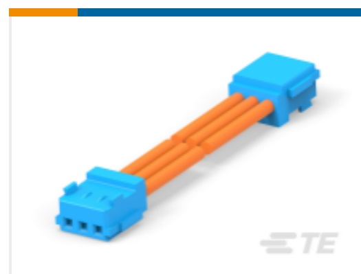
TE 产品编号 2405870-3 CT 3P 300MM CABLE ASSEMBLY 6-353908-3