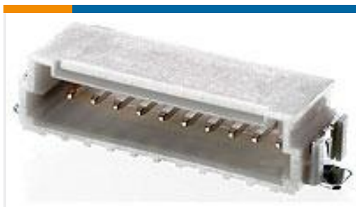
TE 产品编号292228-3 1.5 MINI CT SGL H SMT W/O BOSS