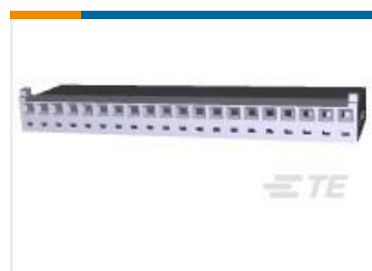
TE 产品编号2-1375820-0 CST-100 II HOUSING 20 POS