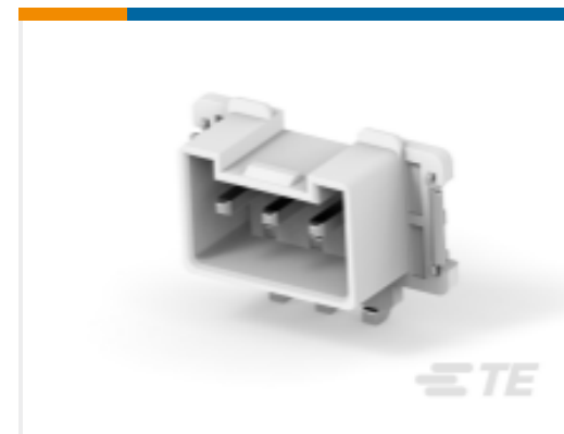
TE 产品编号 2154829-2 High Power Inverted Thru Board Con 3 Pos