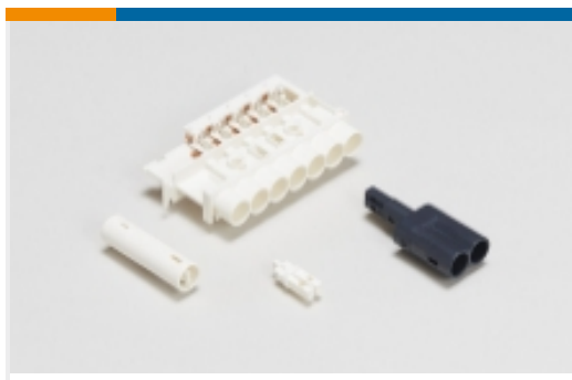
插头和插座照明连接器(33)