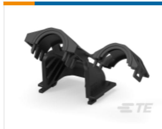
TE 产品编号2386231-1 REC CONN CVR,48POS,MCON 1.2,45 DEG