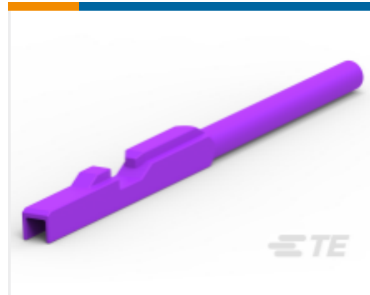
TE 产品编号2286476-1 BLIND PLUG,MCON 1.2 CB