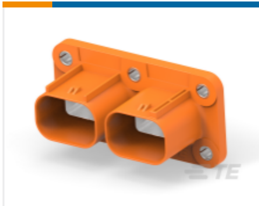
TE 产品编号1-2103346-2 HVA280 2 Bay Header Sub-Assy, KEY D, F