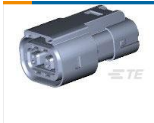
TE 产品编号2103149-4 PLUG, HVIL ONLY, KEY D, HVA280-2PHI