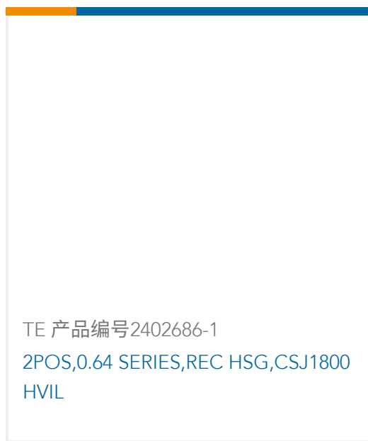
TE 产品编号2402686-1 2POS,0.64 SERIES,REC HSG,CSJ1800 HVIL