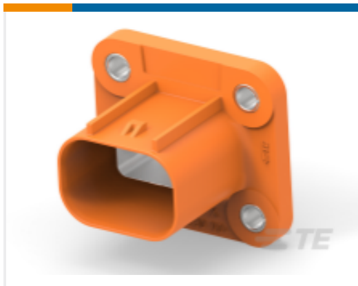
TE 产品编号2310541-2 SPLIT HEADER ASSY, KEY B, HVA280, V0