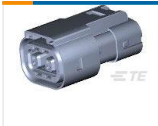
TE 产品编号2103149-2 PLUG, HVIL ONLY, KEY B, HVA280-2PHI