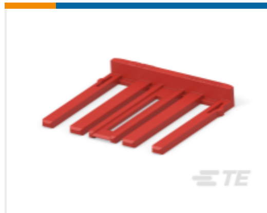
TE 产品编号2386229-1 TPA REC HSG,48POS,MCON 1.2