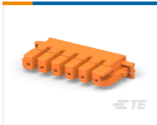
TE 产品编号2322948-2 6POS,MQS,REC HSG,UNSLD