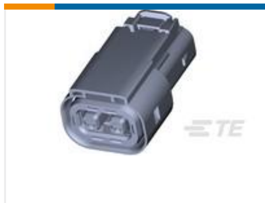
TE 产品编号4-2103177-5 PLUG ASSY, KEY E, FA,CPA, HVA280- 2PHI XE