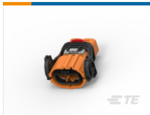
TE 产品编号1-2177053-2 2POS,8MM HV,PLUG HSG,ASSY, SEALED