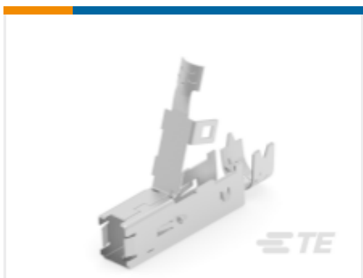
TE 产品编号2291354-1 PLUG SHELL BOTTOM, 0.50 HSL CONNECTOR