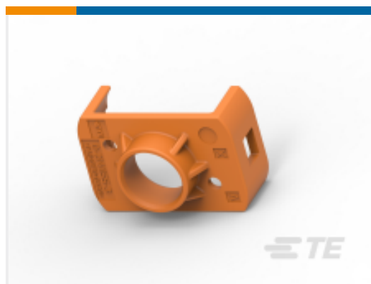
TE 产品编号2141155-3 PROTEC. COVER 8MM HV,90DEG