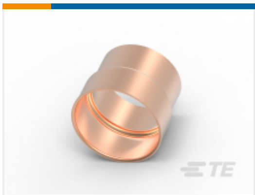
TE 产品编号9-2141157-2 SHIELD CRIMP FERRULE,90DEG