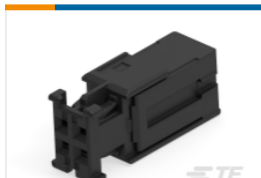
TE 产品编号2293734-1 PLUG HOUSING CAVITY, 4 POS 0.50 HSL CONN