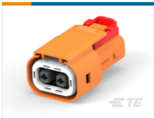
TE 产品编号2103177-1 PLUG ASSY, KEY A, TA,CPA, HVA280- 2PHI XE