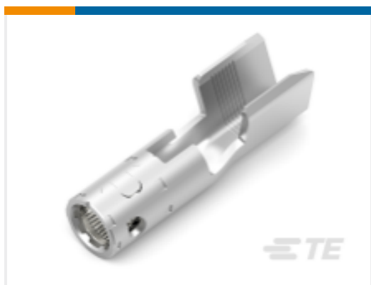
TE 产品编号2208669-3 8MM HV, CONTACT,ASSY